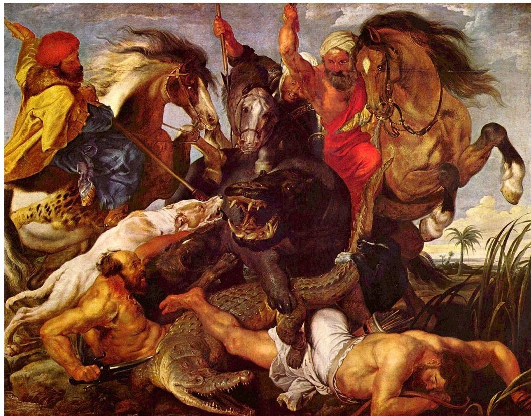
«Охота на гиппопотама», 1618