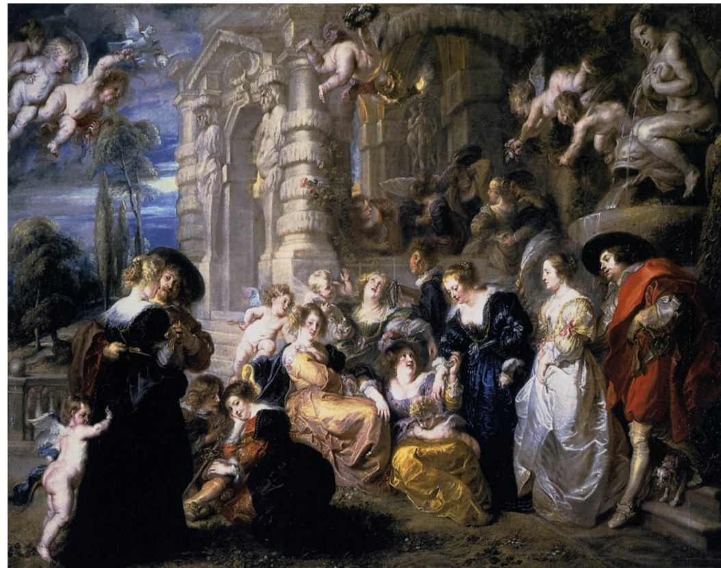
«Сад любви», 1632