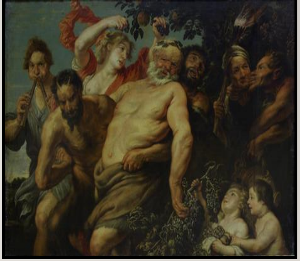
Шествие Силена. Национальная картинная галерея Армении