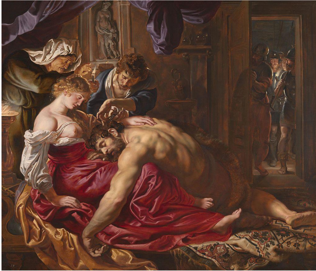
«Самсон и Далила», 1609