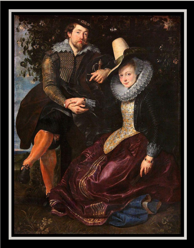
Автопортрет с Изабеллой Брант, 1609