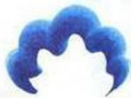
Мазковая роспись. Цветочек