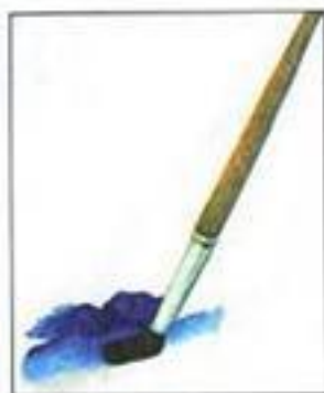
Мазок с тенью