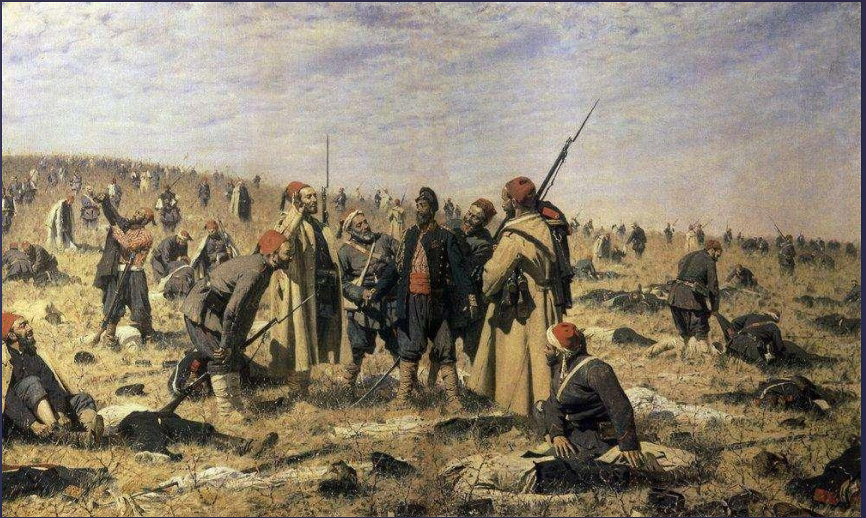
Победители. Художник В.В.Верещагин