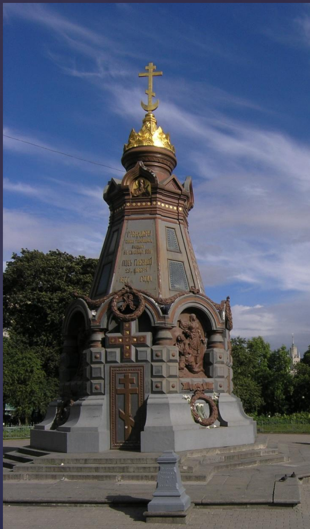
Памятник героям Плевны. Фото XXI века