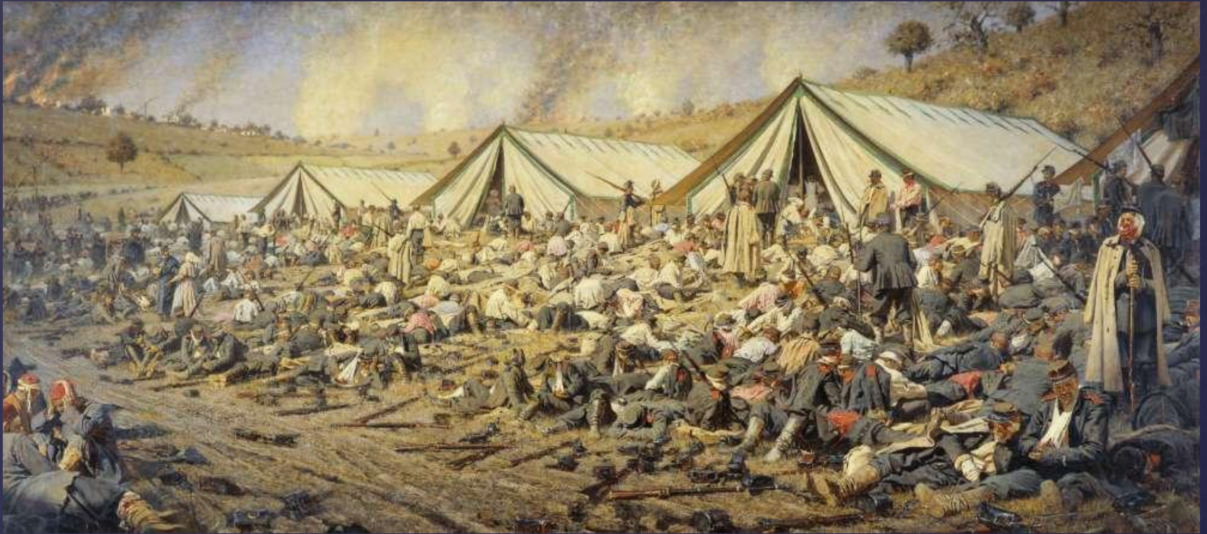
Полевой лазарет. Художник В.В.Верещагин