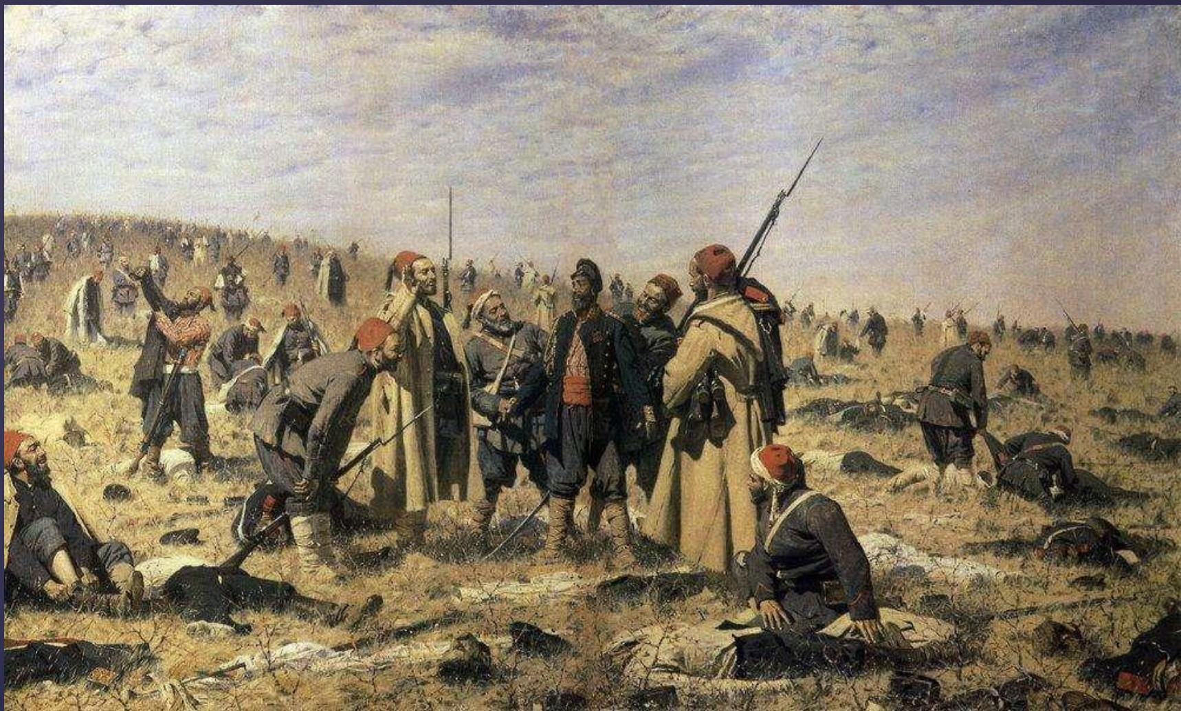
Победители. Художник В.В.Верещагин