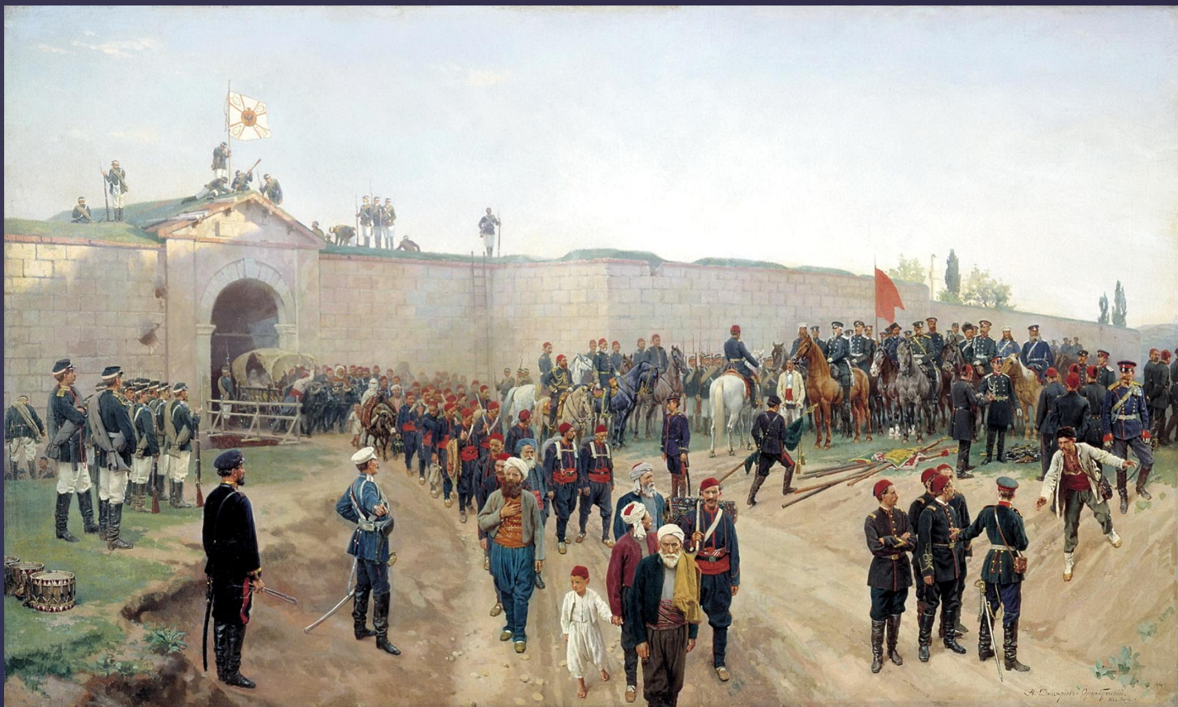
Сдача турками крепости Никополь 4 июня 1877 г. Художник Н.Дмитриев-Оренбургский. 1883 г.