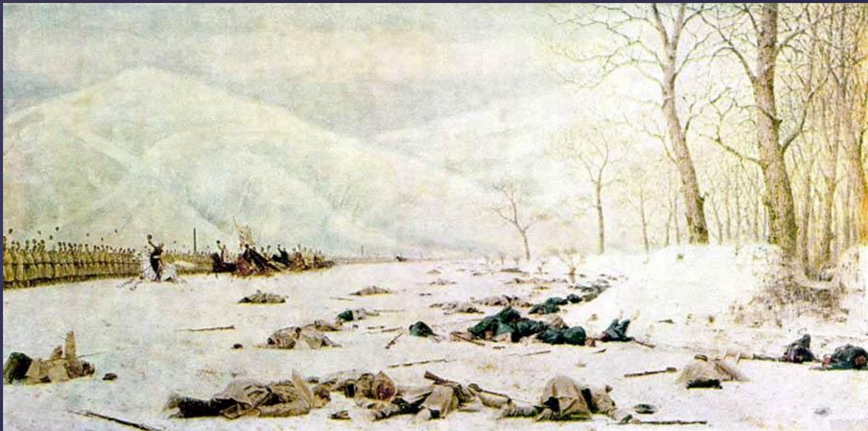
В.В.Верещагин. «Скобелев под Шипкой – Шейново»