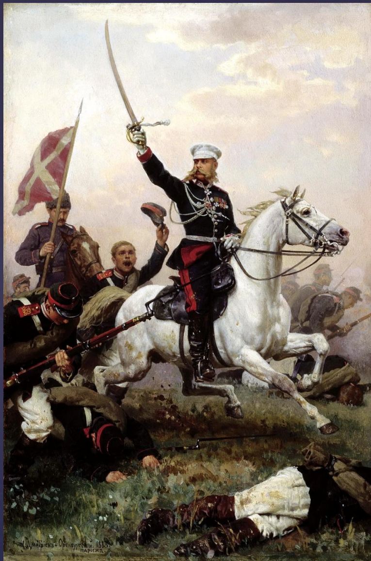
«Генерал М.Д.Скобелев на коне» Художник Н.Д.Дмитриев-Оренбургский. 1883 г.