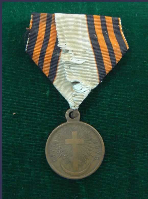
Медаль участника Русско-турецкой войны 1877–1878 гг. Лицевая сторона