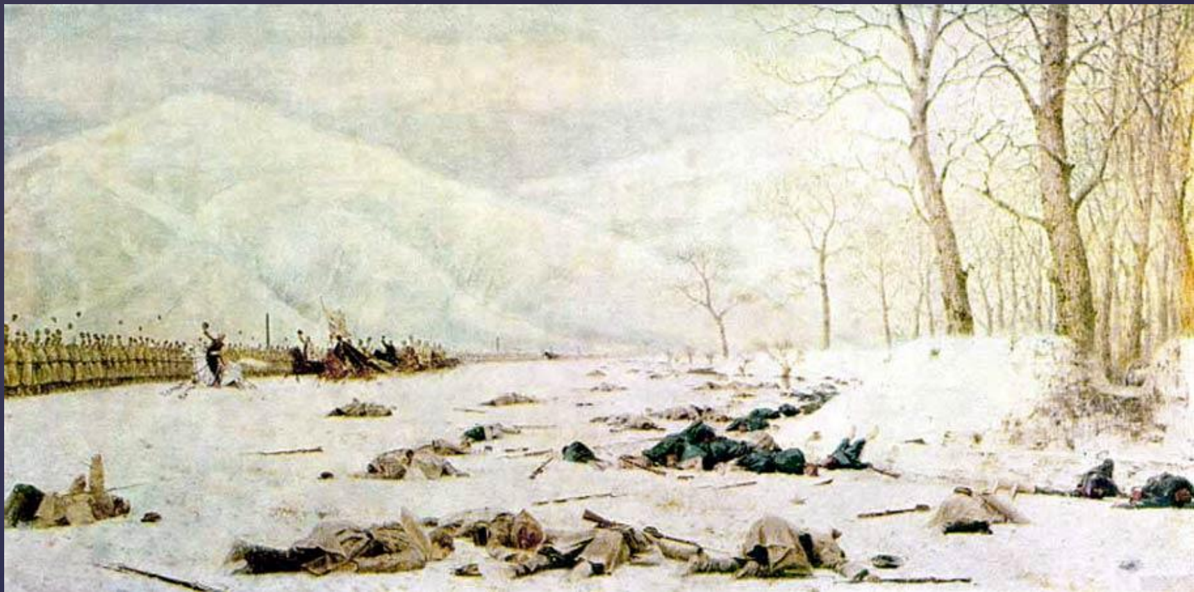
В.В.Верещагин. «Скобелев под Шипкой – Шейново»