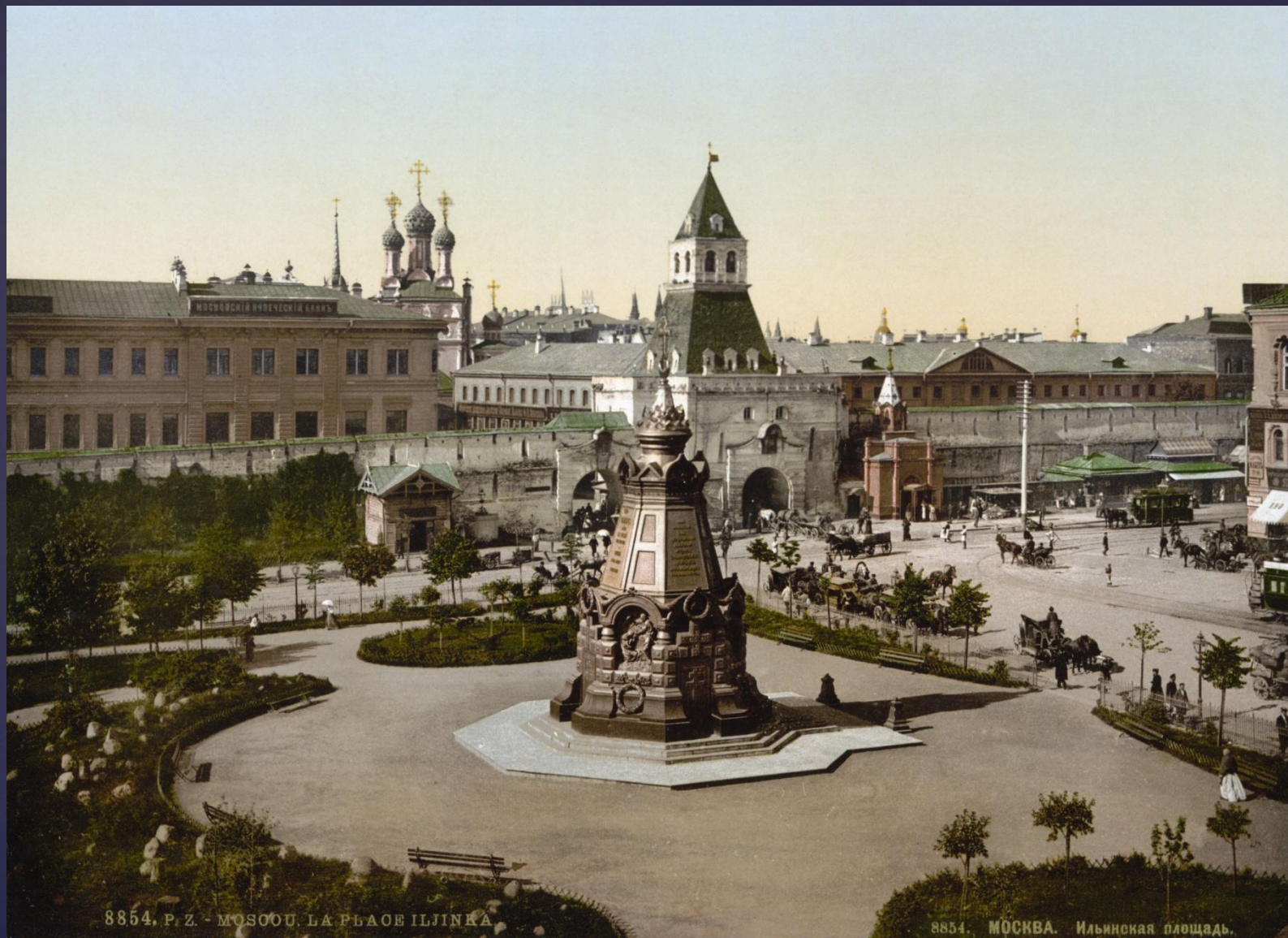
Памятник героям Плевны. Открытка XIX века