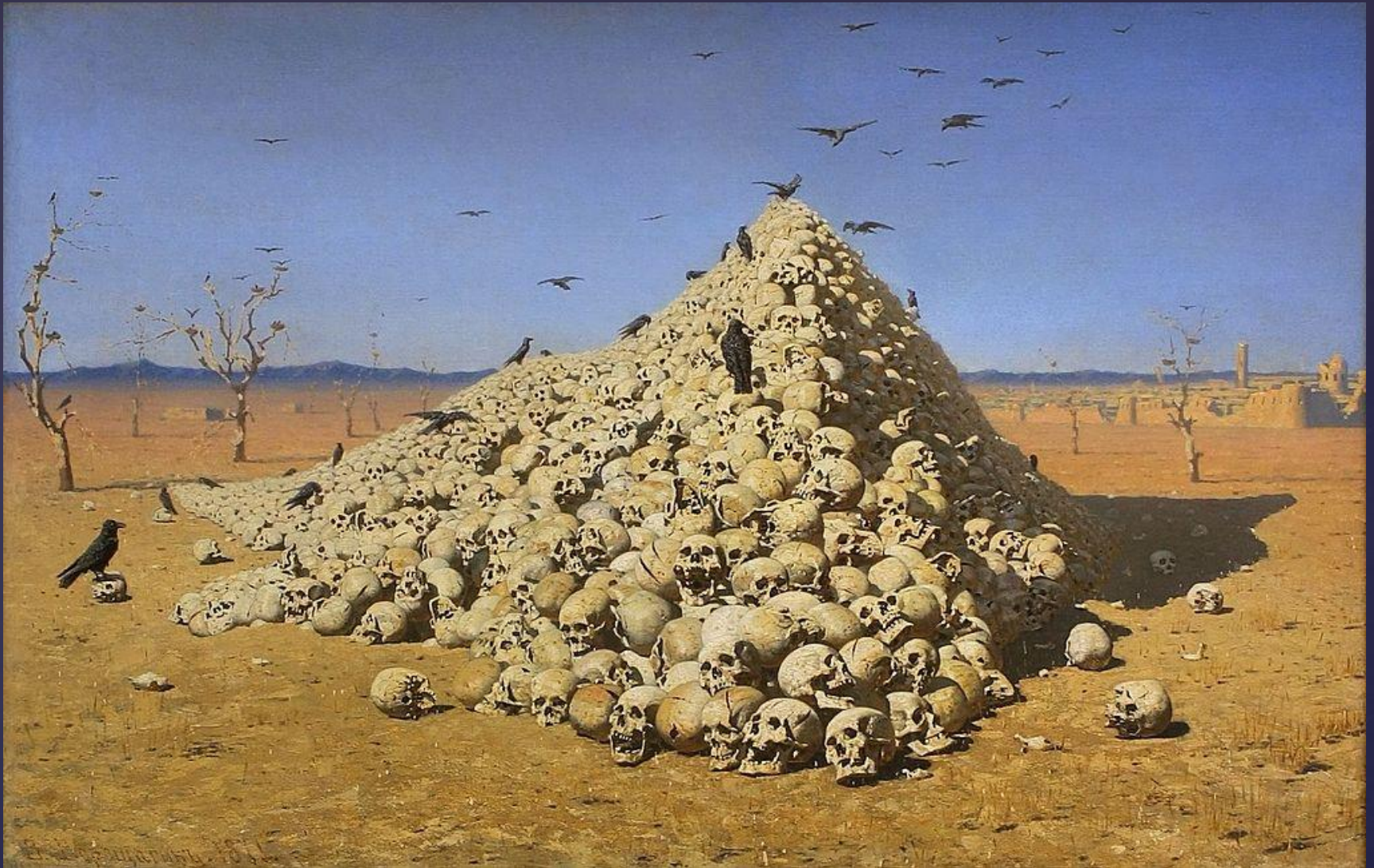
В.В.Верещагин. «Апофеоз войны»