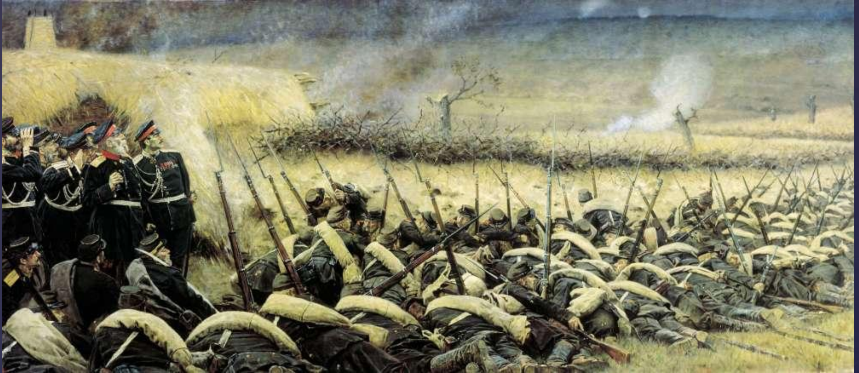
Перед атакой. Художник В.В.Верещагин