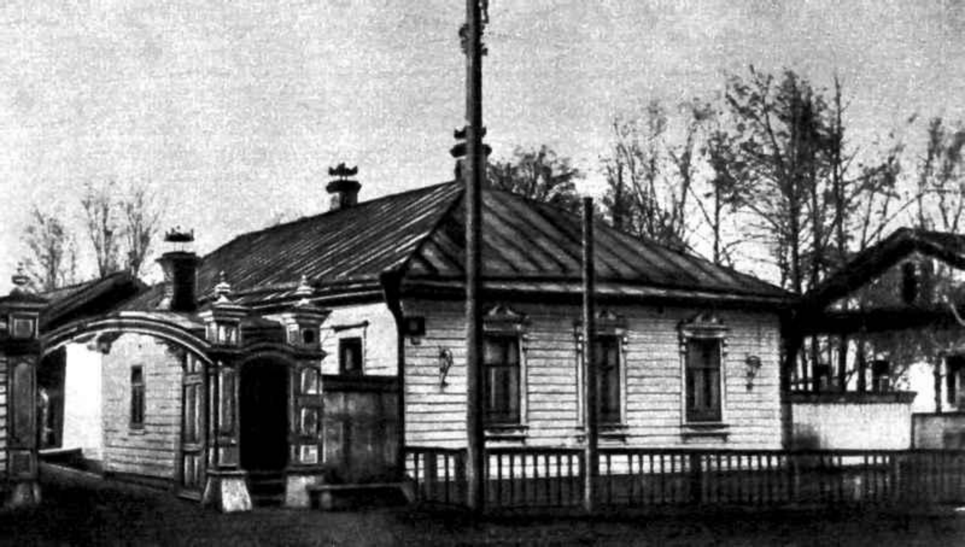
Дом в Вятке, где жил М.Е.Салтыков