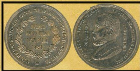
Жетон «Премия Уварова»