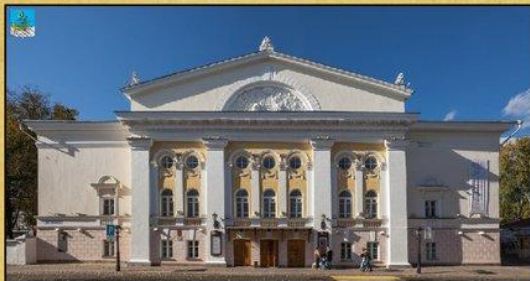
Театр имени Островского