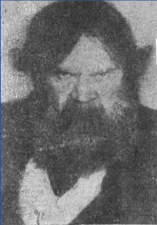
Дикой. Артист М. М. Тарханов.