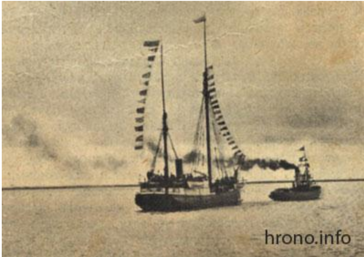
судно "Святой Фока"

14(27) августа 1912 г. судно "Святой Фока" вышло из Архангельска