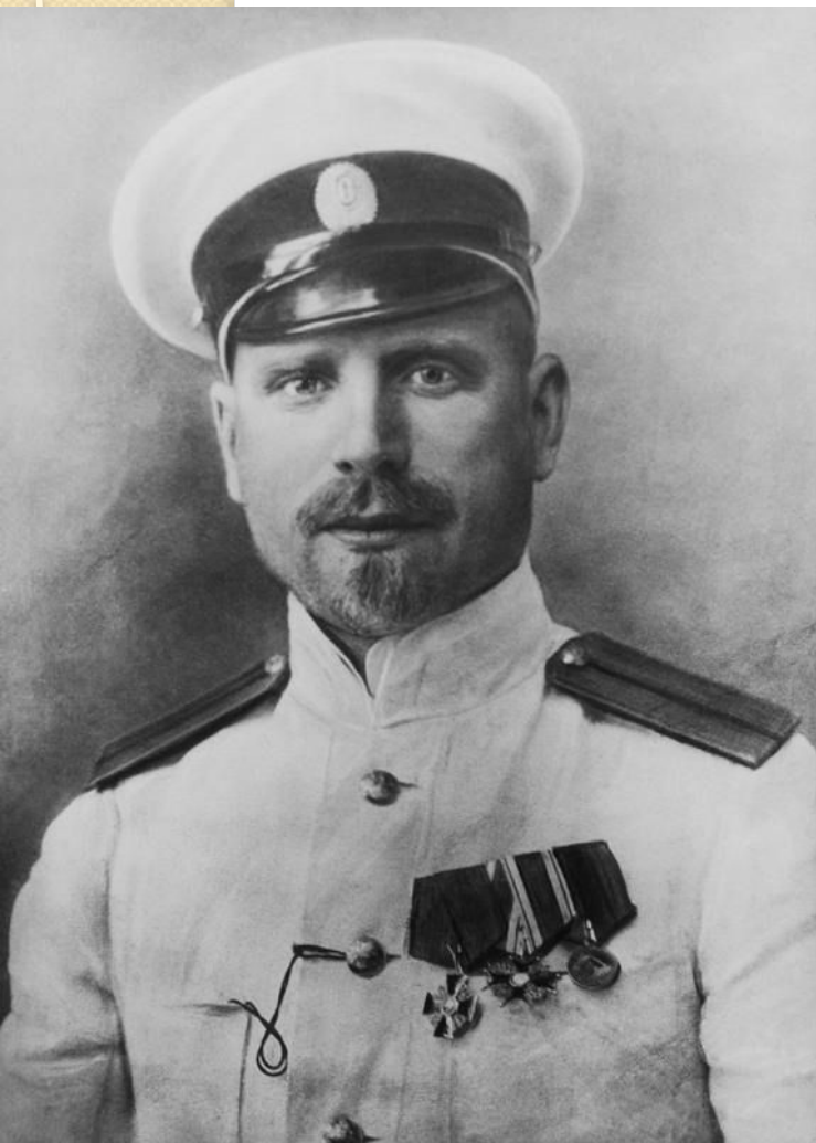
Седов Георгий Яковлевич (1877-1914)

В 1898 г. окончил мореходные классы в Ростове-на-Дону и получил звание штурмана дальнего плавания.