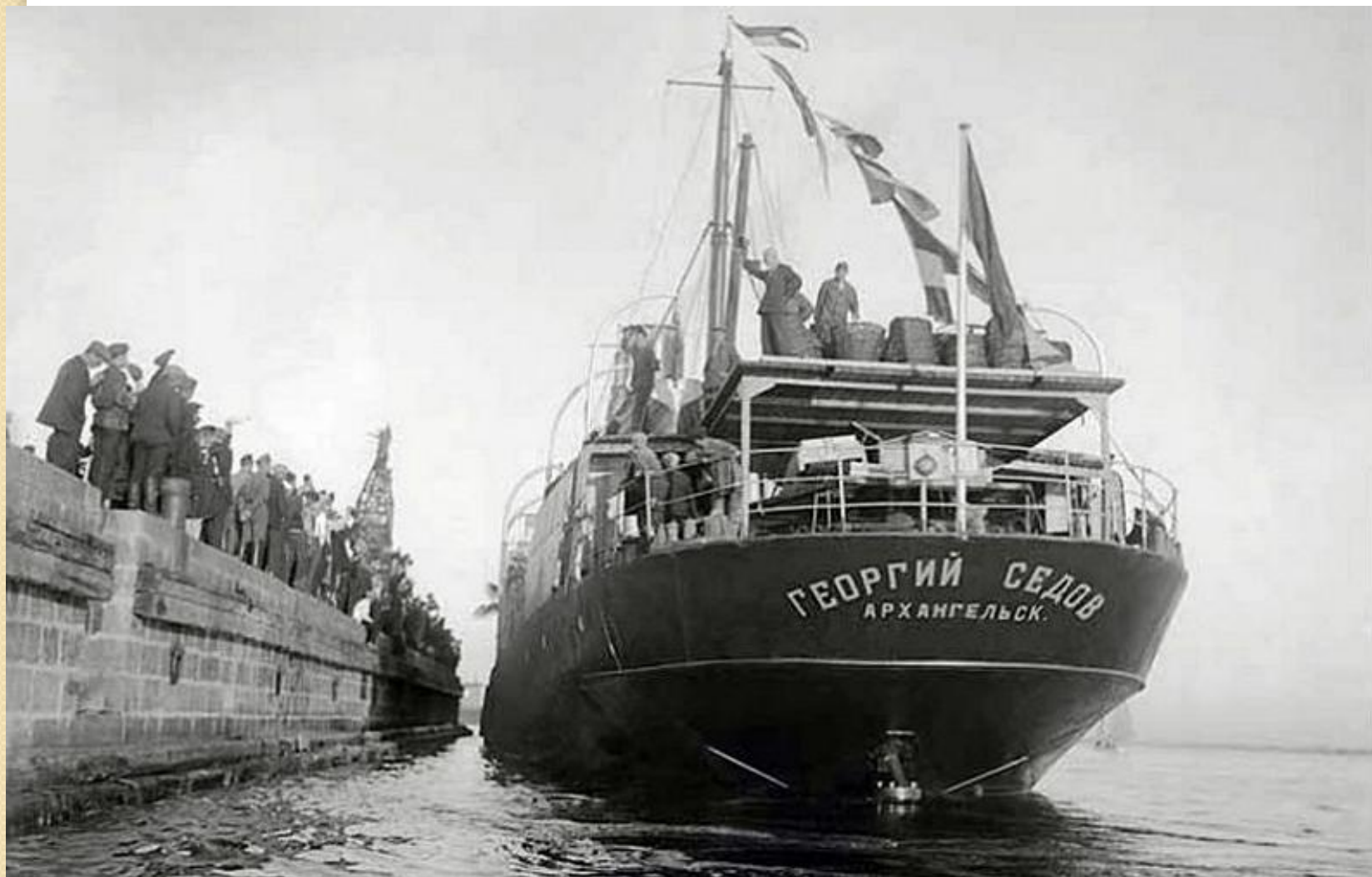
Ледокольный пароход «Георгий Седов»