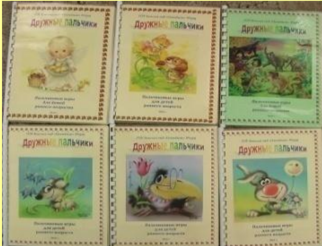
Копилка пальчиковых игр