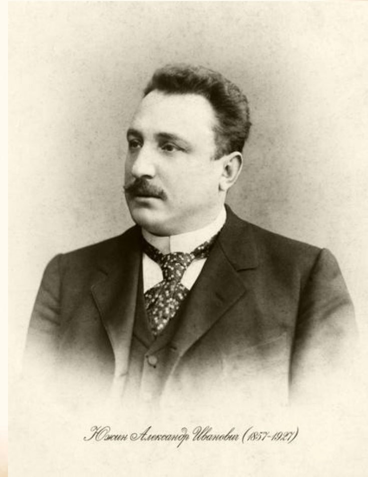
Южин Александр Иванович (1857-1927)