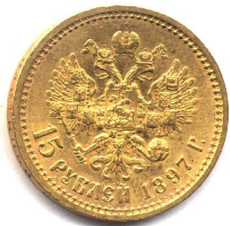
15 рублей Николая II

Несомненной заслугой С. Витте является проведенная им денежной реформы 1895-1897 гг. В результате Россия на период до 1914 года получила устойчивую валюту, обеспеченную золотом. Были введены в оборот новые железные деньги, тем самым процент бумажных денег в обороте начал уменьшаться.