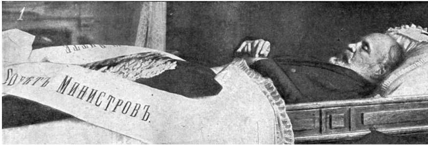
Фото С. Ю. Витте в гробу

Похоронен на Лазаревском кладбище Александро-Невской лавры.