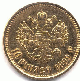
Золотой десятирублѣвик Николая II. 1899. Реверс