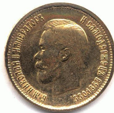
Золотой десятирублѣвик Николая II. 1899. Аверс