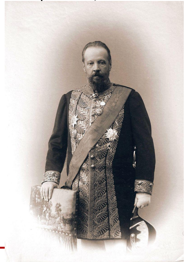
С. Ю. Витте на посту министра финансов

В 1896 году провел успешные переговоры с китайским представителем Ли Хунчжаном, добившись согласия на сооружение в Маньчжурии Китайско-Восточной железной дороги (КВЖД), что позволило провести дорогу до Востока. Одновременно с Китаем был заключен союзный оборонительный договор.