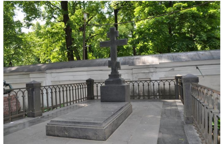
Фото могилы С. Ю. Витте. Санкт-Петербург