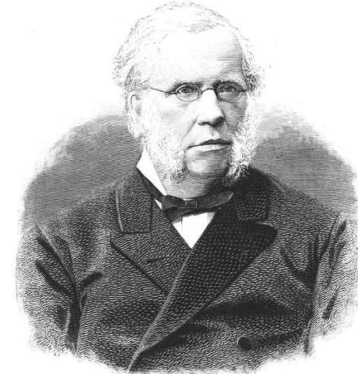
И. А. Вышнеградский

В 1891 году был принят новый таможенный тариф России, разработанный при активном участии С. Витте и Д. И. Менделеева. Этот тариф сыграл важную роль во внешне тоговой политике России и стал защитным барьером для развивавшейся промышленности.