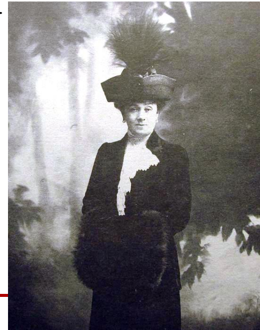
М. И. Витте

Спустя год Витте женился на Марии Ивановне Лисаневич, урожденной Матильде Исааковне Нурок. Женитьбе предшествовал скандал, так как Витте начал встречаться с ней еще до еще развода. Это могло стоить Витте карьеры, так как скандальная женитьба на разведенной ев тогда не приветствовалась. В результате и без того не самые теплые отношения Витте с высшим советом еще более ухудшились.