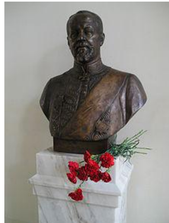
Бюст С. Ю. Витте в Санкт-Петербурге