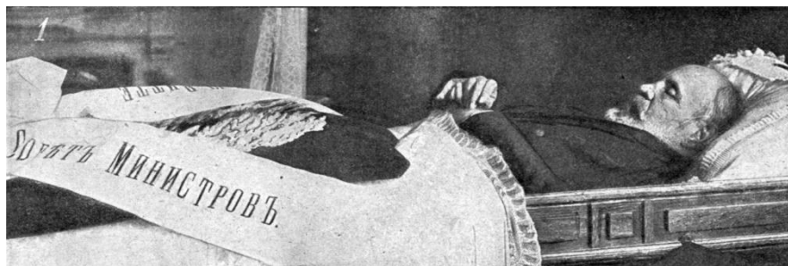
Фото С. Ю. Витте в гробу

Похоронен на Лазаревском кладбище Александро-Невской лавры.