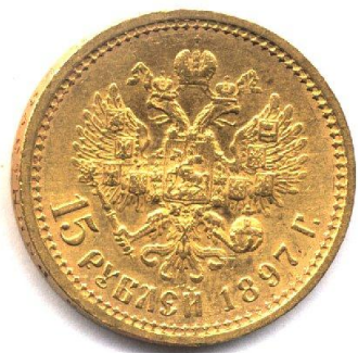
15 рублей Николая II

Несомненной заслугой С. Витте является проведенная им денежной реформы 1895-1897 гг. В результате Россия на период до 1914 года получила устойчивую валюту, обеспеченную золотом. Были введены в оборот новые железные деньги, тем самым процент бумажных денег в обороте начал уменьшаться.