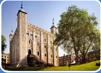
Tower of London