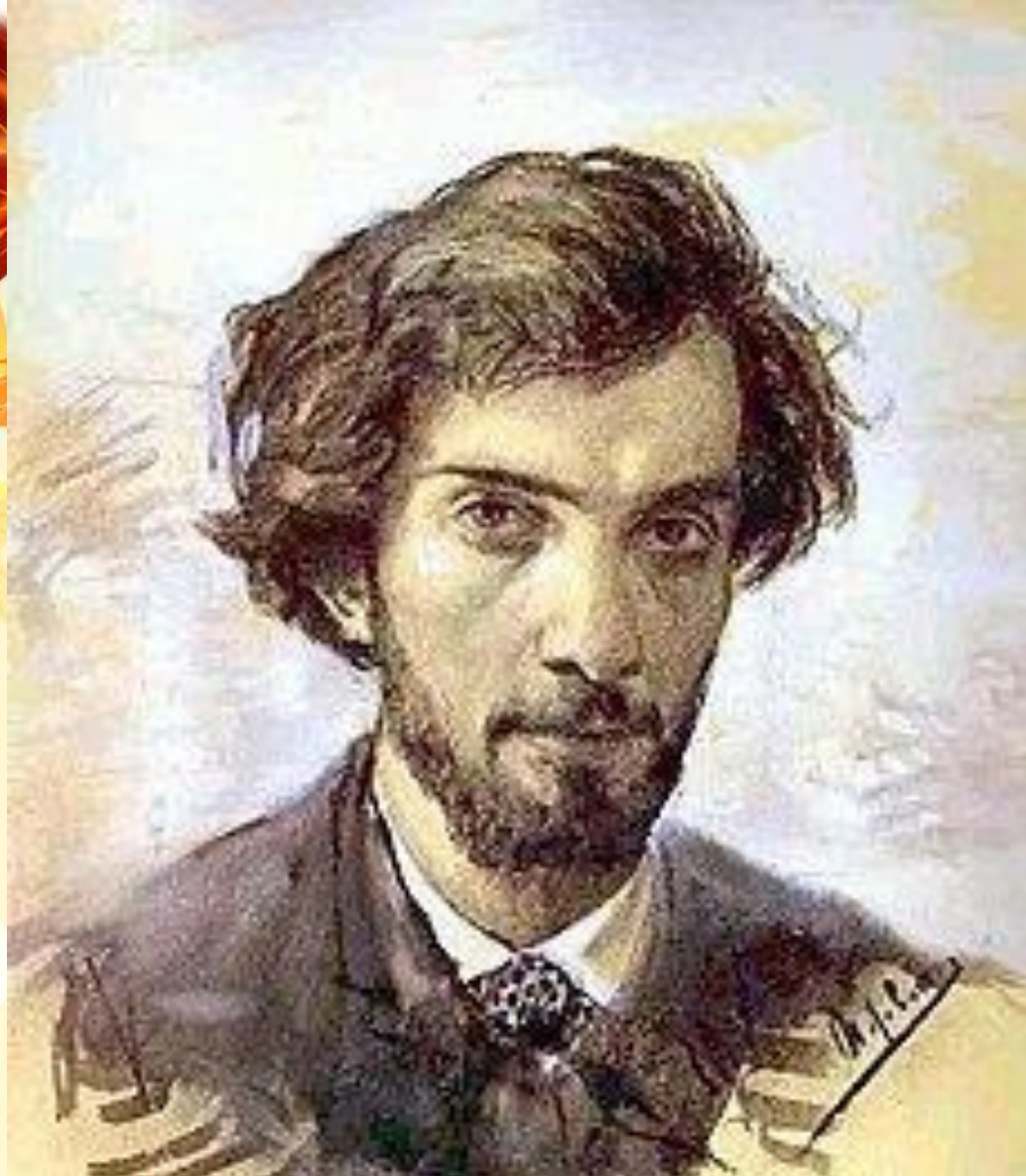
Левитан Исаак Ильич