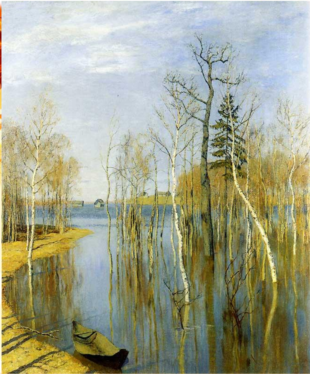
Весна. Большая вода.