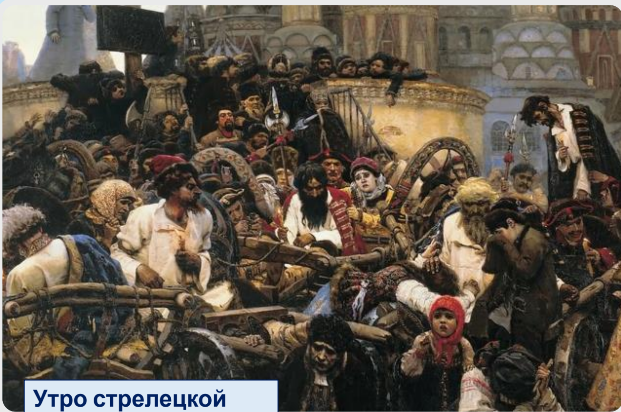
Утро стрелецкой казни

В начале XVIII века наибольшее распространение получают солдатские песни. Это связано и с расправой Петра со стрельцами, и с войнами, которые велись в Петровскую эпоху. Солдатская песня становится основной исторической песней на Руси. В ней найдут отражение победы русского оружия под Шлиссельбургом, Ревелем, Ригой, Полтавой в Петровскую эпоху и победы над Наполеоном в период Отечественной войны 1812 года. Персонажами этих песен станут Суворов и Потёмкин, Кутузов и Платов