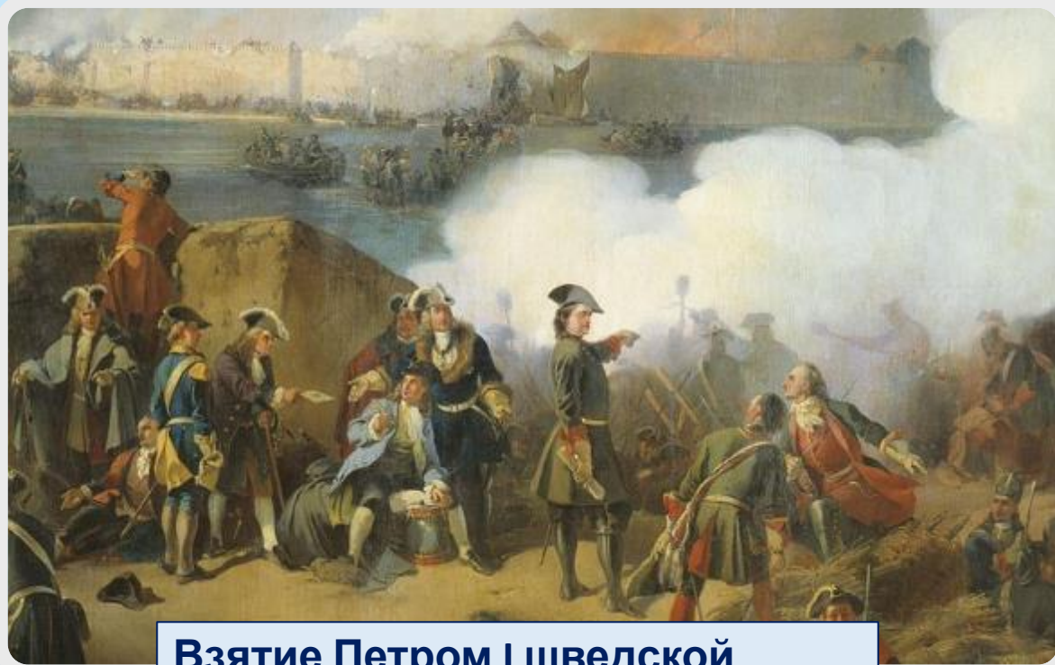
Взятие Петром I шведской крепости