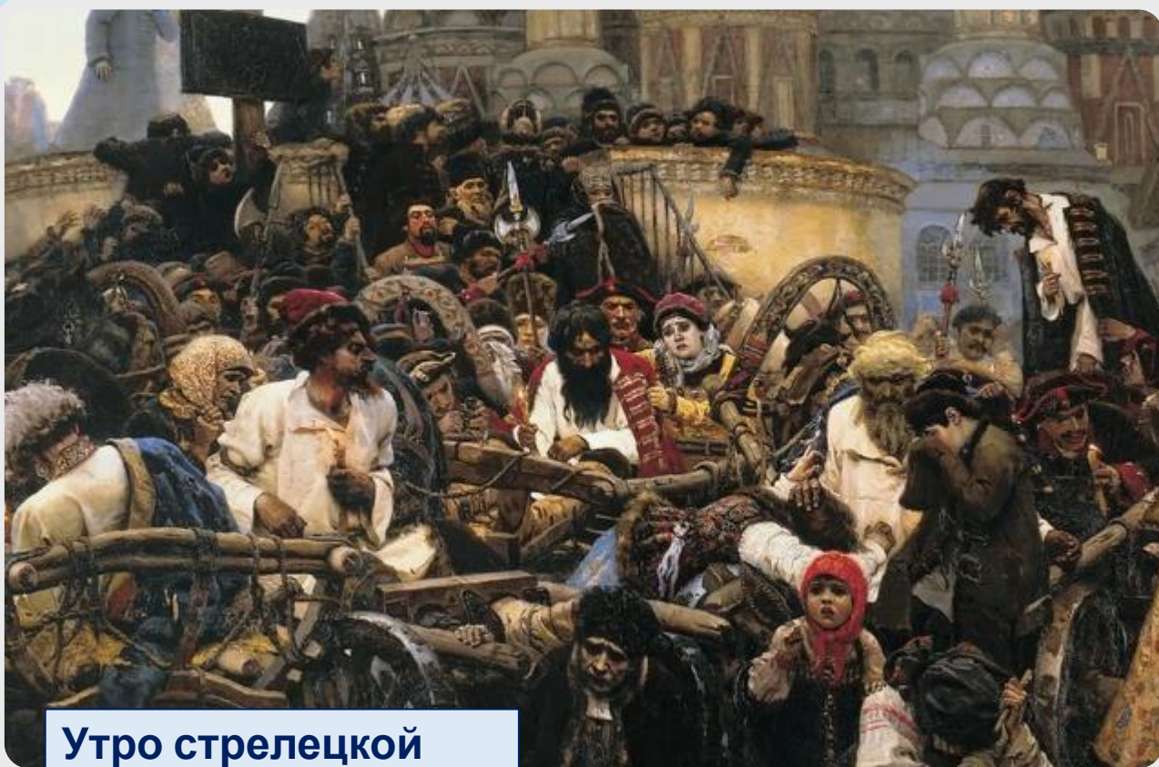
Утро стрелецкой казни

В начале XVIII века наибольшее распространение получают солдатские песни. Это связано и с расправой Петра со стрельцами, и с войнами, которые велись в Петровскую эпоху. Солдатская песня становится основной исторической песней на Руси. В ней найдут отражение победы русского оружия под Шлиссельбургом, Ревелем, Ригой, Полтавой в Петровскую эпоху и победы над Наполеоном в период Отечественной войны 1812 года. Персонажами этих песен станут Суворов и Потёмкин, Кутузов и Платов