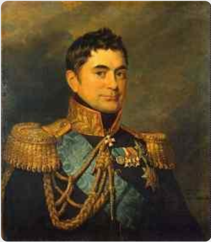
Петр Михайлович Волконский (1776 – 1852) – генерал – фельдмаршал, светлейший князь, участвовал в боях при Березине

Песня «Солдаты освобождают Смоленск» связана с событиями Отечественной войны 1812 года. В основе песни - освобождение Смоленска русской армией. В этой песне трудно выделить один лирический персонаж по той причине, что она посвящена всем героям, чья смелость и самоотверженность помогли освободить город. Это и князь Волконский , и обычные солдаты, не побоявшиеся riskовать своей жизнью ради освобождения родной земли. Песня написана в ритмической манере, изобилует повторами, прямой речью. Повторы акцентируют внимание на особенно важных деталях.