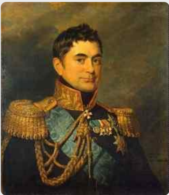
Петр Михайлович Волконский (1776 – 1852) – генерал – фельдмаршал, светлейший князь, участвовал в боях при Березине

Песня «Солдаты освобождают Смоленск» связана с событиями Отечественной войны 1812 года. В основе песни - освобождение Смоленска русской армией. В этой песне трудно выделить один лирический персонаж по той причине, что она посвящена всем героям, чья смелость и самоотверженность помогли освободить город. Это и князь Волконский , и обычные солдаты, не побоявшиеся riskовать своей жизнью ради освобождения родной земли. Песня написана в ритмической манере, изобилует повторами, прямой речью. Повторы акцентируют внимание на особенно важных деталях.