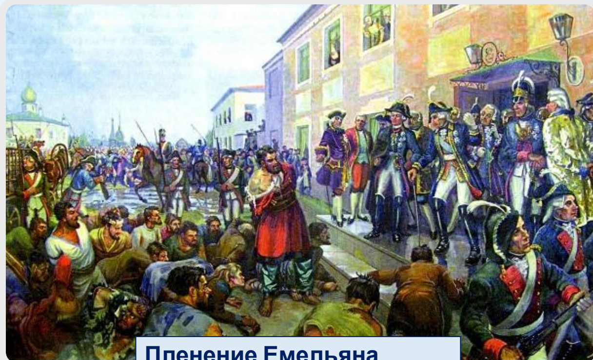
Пленение Емельяна Пугачева