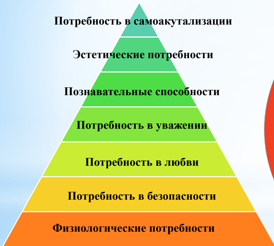
Иерархия потребностей Маслоу