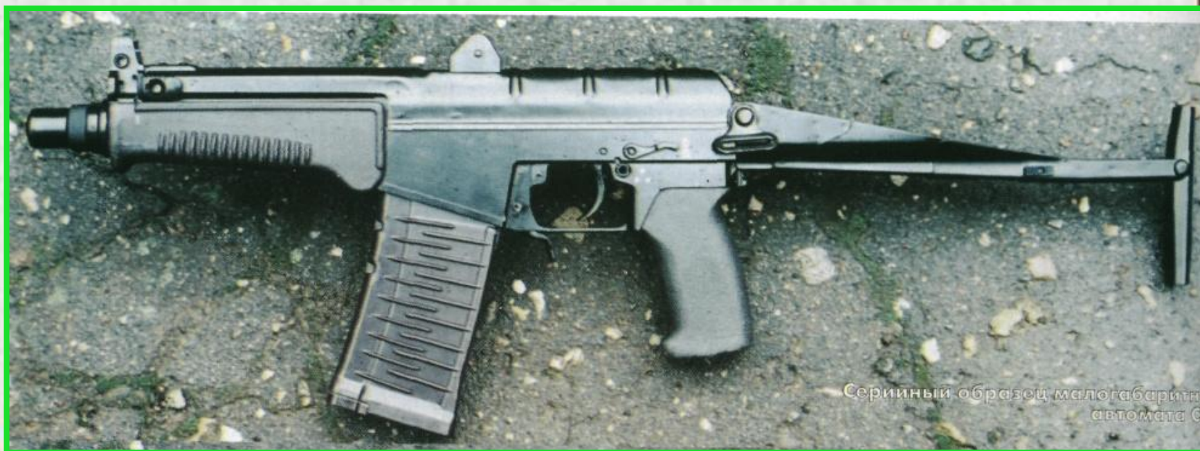
Серийный образец малогабаритного автомата СР-3