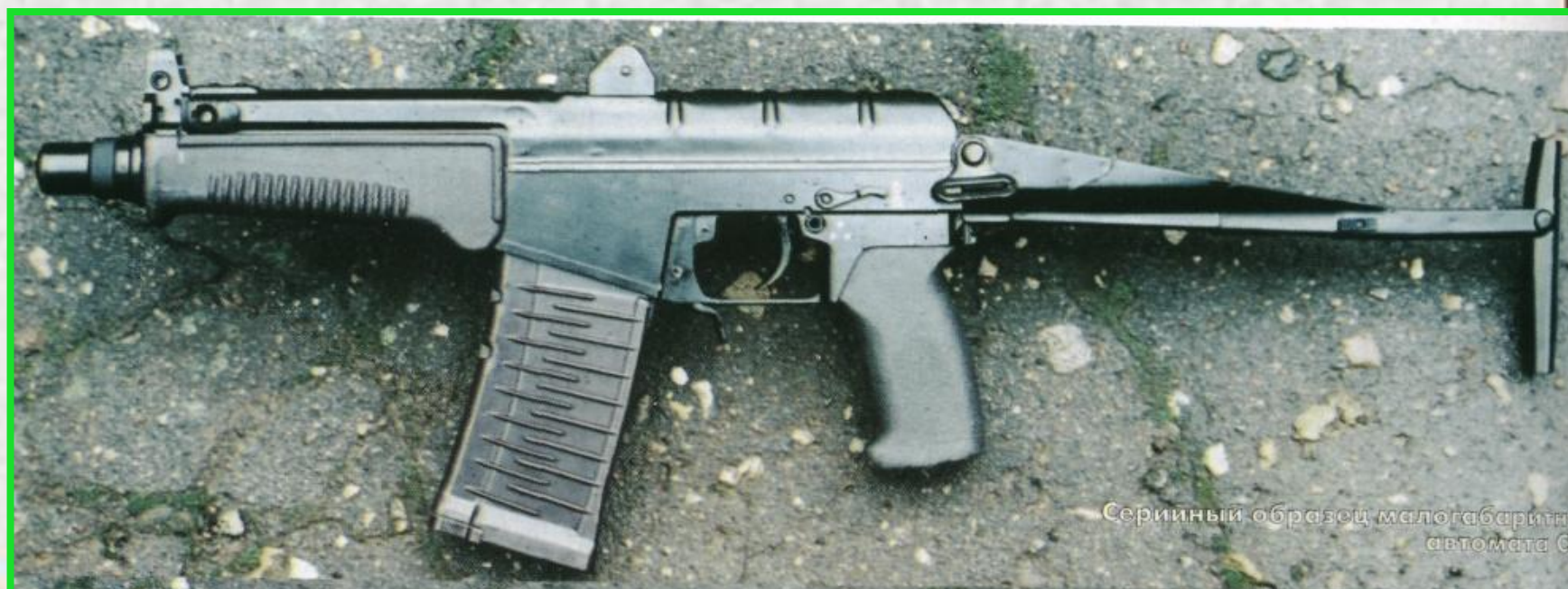
Серийный образец малогабаритного автомата СР-3