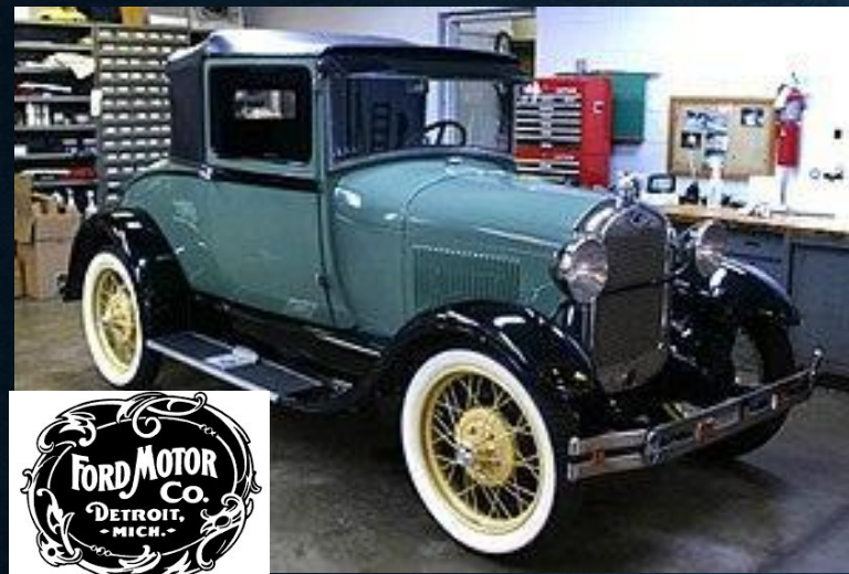
Модель А (1903)