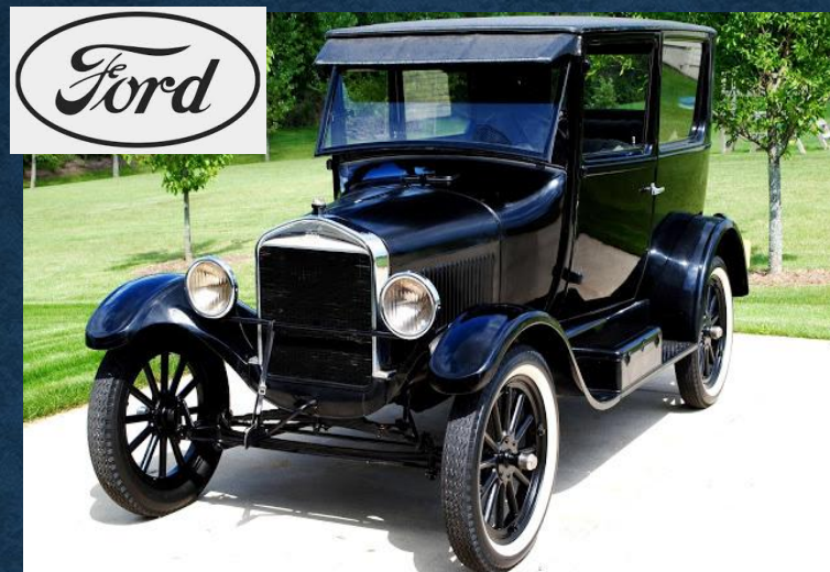
Модель Т (1911)