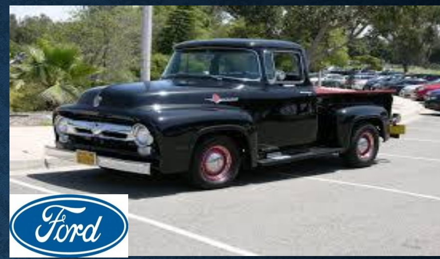
Грузовой автомобиль (1934)