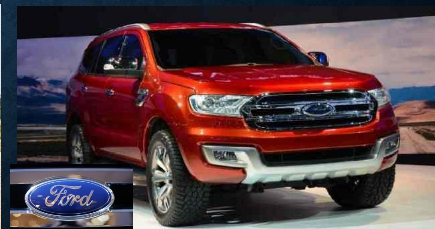
Ford Everest (2018)