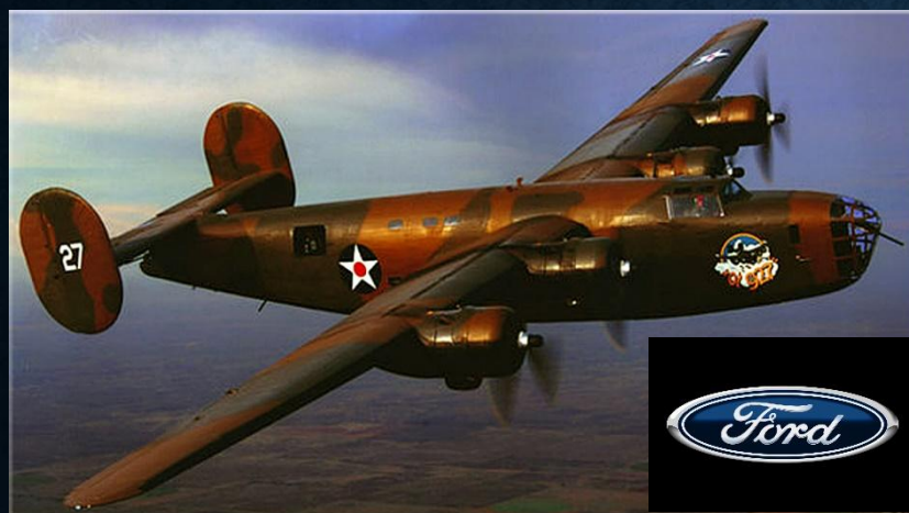
В-24 Либератор (1942)