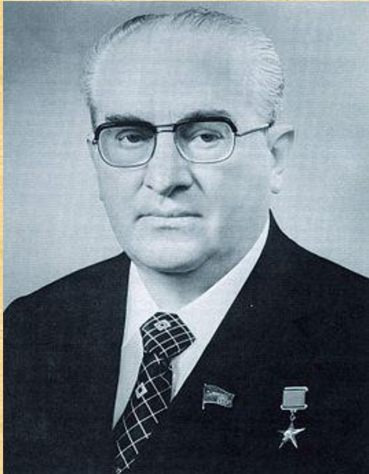
Андропов 1982 – 1984 г. Г.