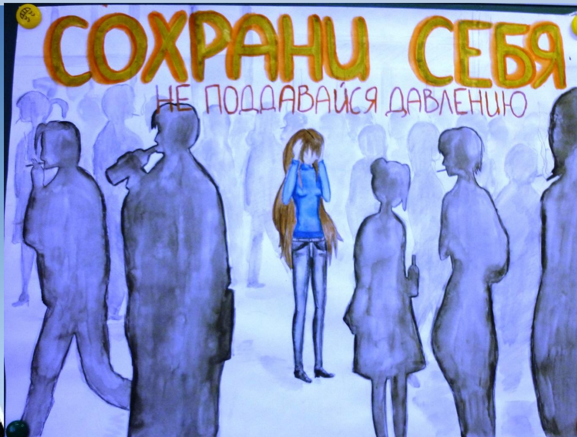
Плакат «Сохрани себя», проект 10 «А» класса, 2012-13 уч. год

Явления, получившие название “пагубные привычки” , широко распространены сегодня в молодежной среде и оказывают огромное влияние на жизнь подростков любой возрастной группы