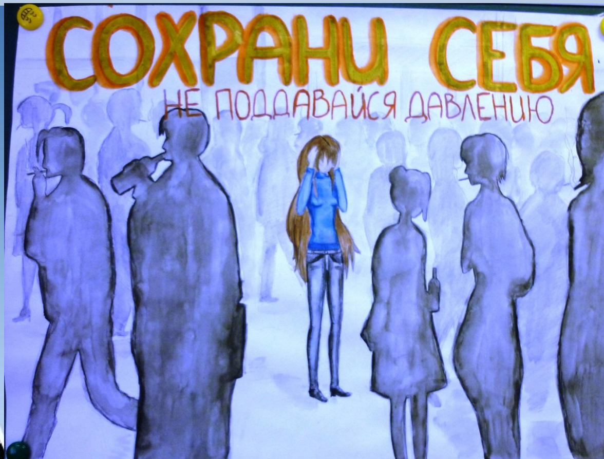
Плакат «Сохрани себя», проект 10 «А» класса, 2012-13 уч. год

Явления, получившие название “пагубные привычки” , широко распространены сегодня в молодежной среде и оказывают огромное влияние на жизнь подростков любой возрастной группы