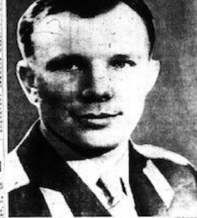
This is the official portrait of Yuri Gagarin, the first man in space.

Astronaut Reported in Good Condition He Circles Globe Once and is Brought Back to Landing in Russia; His Entire Trip Took Only 108 Minutes; Messages to Moscow Describe History's First Space Flight