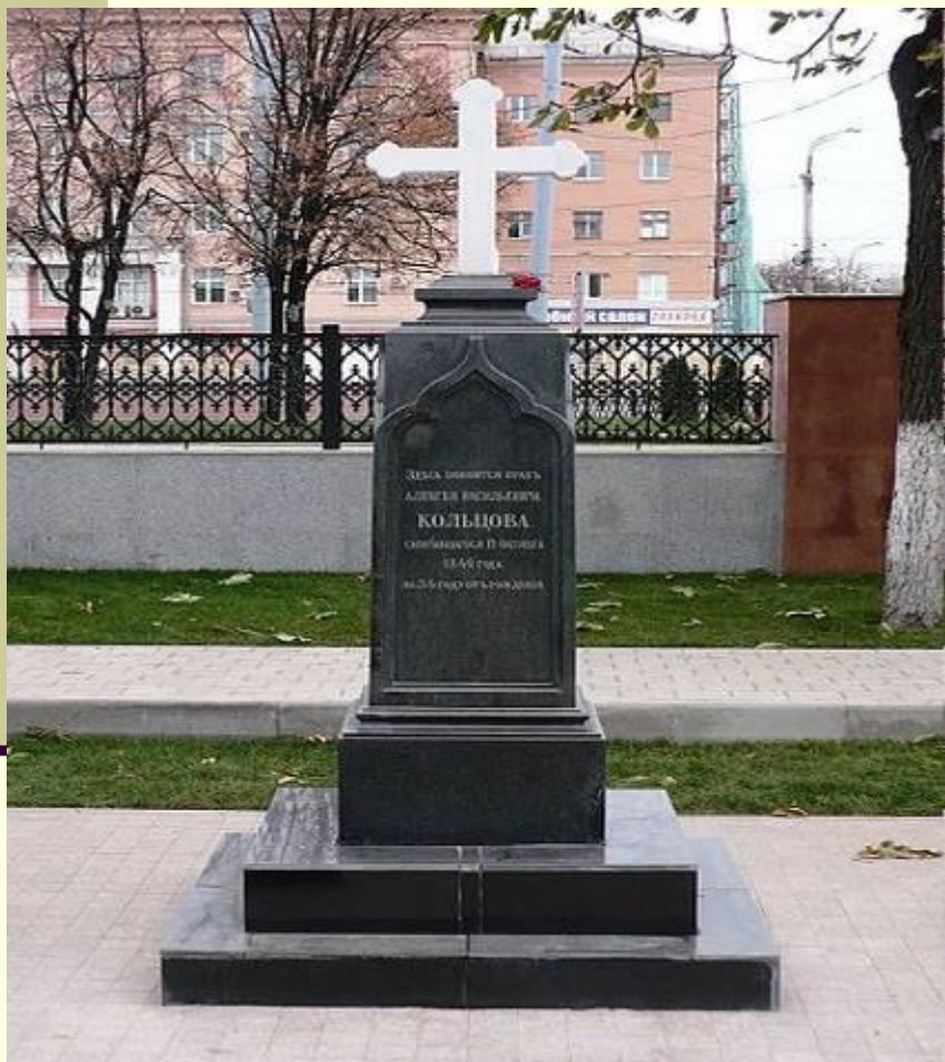
2009 год (после реконструкции)