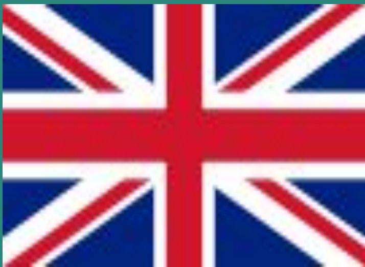
Державний прапор Великобританії