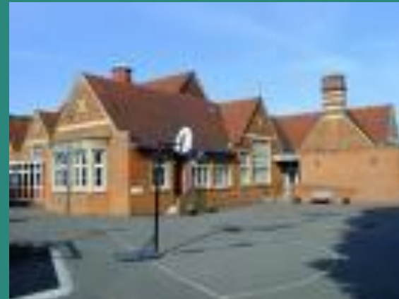
Milton Road Junior School