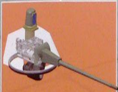
Масса - 2,5 т