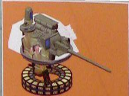
Масса - 4 т