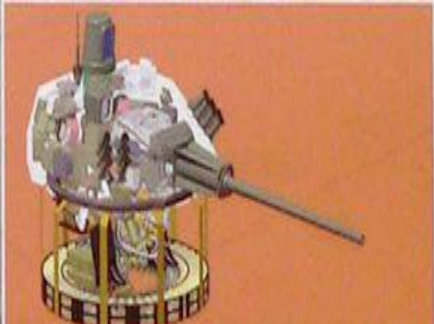
Масса - 3,6 т