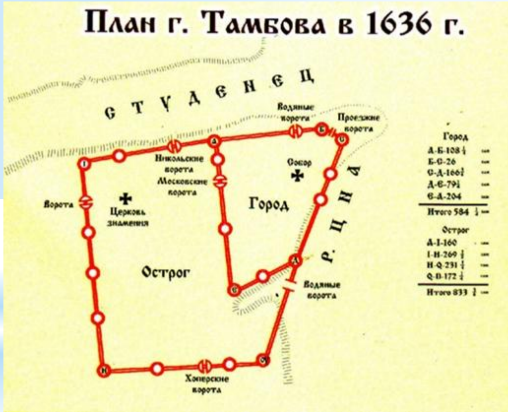
План г. Тамбова в 1636 г.

Начало древней Тамбовщины, её исток-это крепость Тамбов. Возникла она в 1636 году на лесистых топких берегах Цны, где сливается с ней речка Студенец.