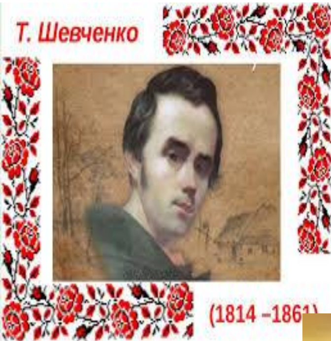
Фото Тараса Шевченка