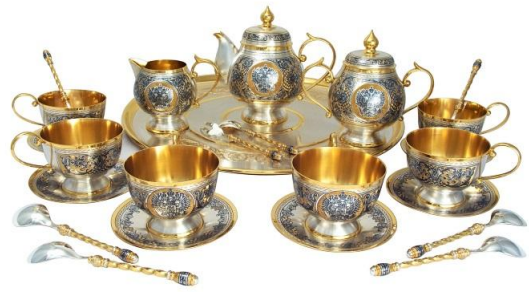
l'émail de niellure