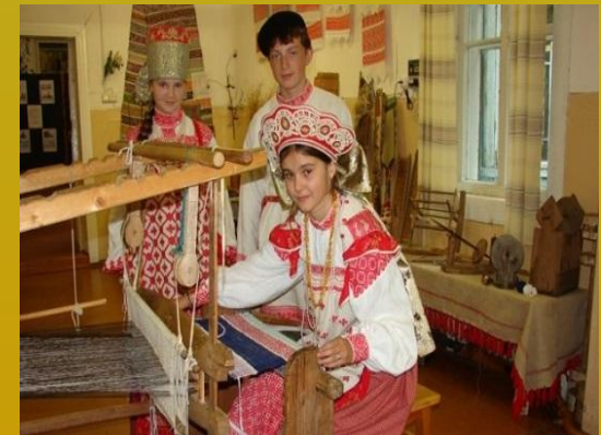
les produits de lin