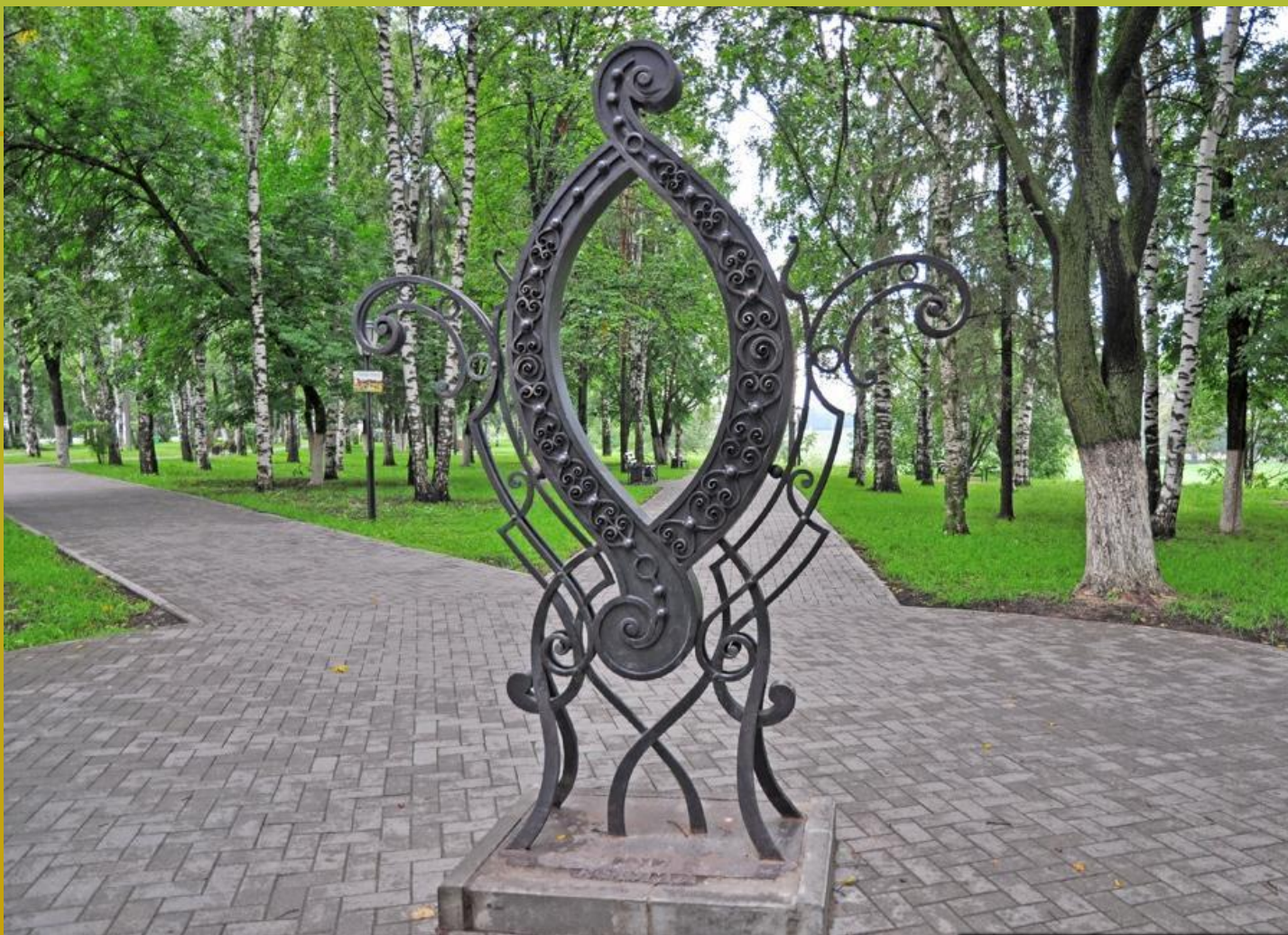
le monument de la lettre «O»