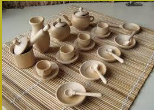
les vaisseau en bois