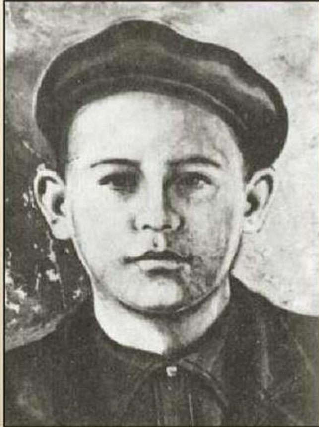
le petit Nicolas

Nicolas Mikhaïlovitch Rubtsov (3 janvier 1936 – 19 janvier 1971) est un poète de Vologda