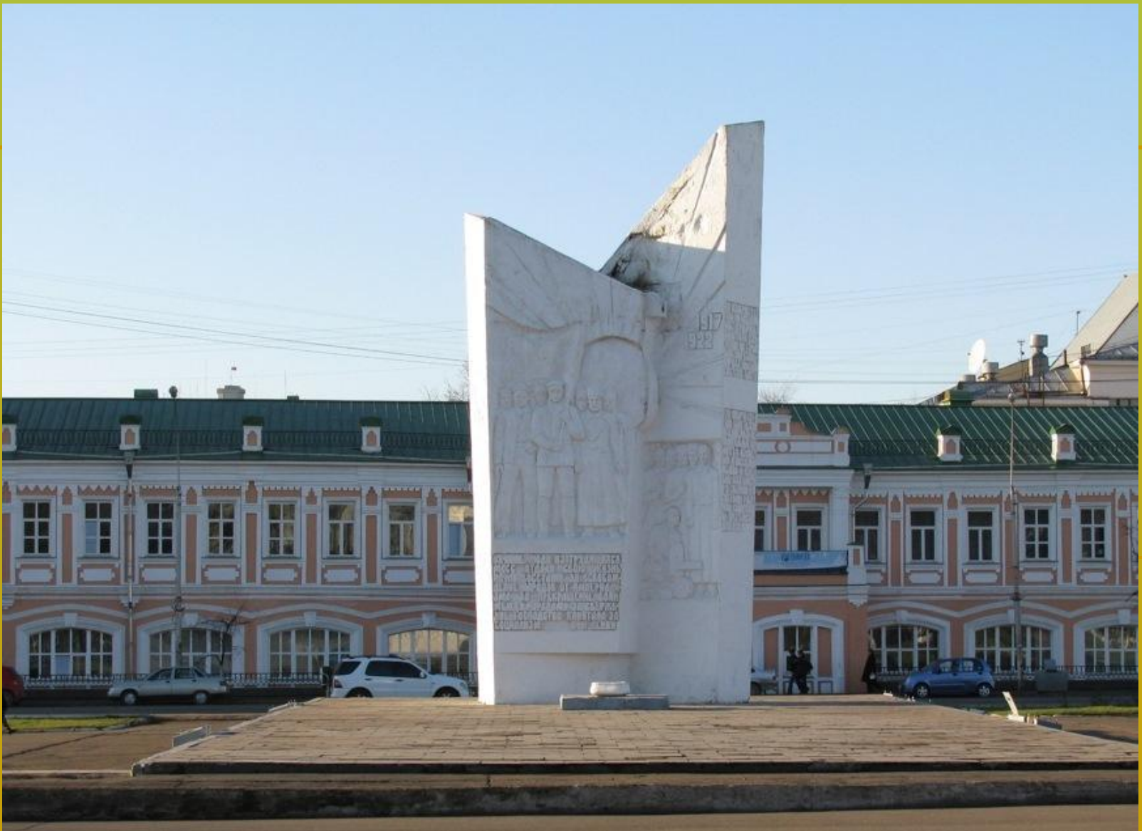
la place de la Révolution