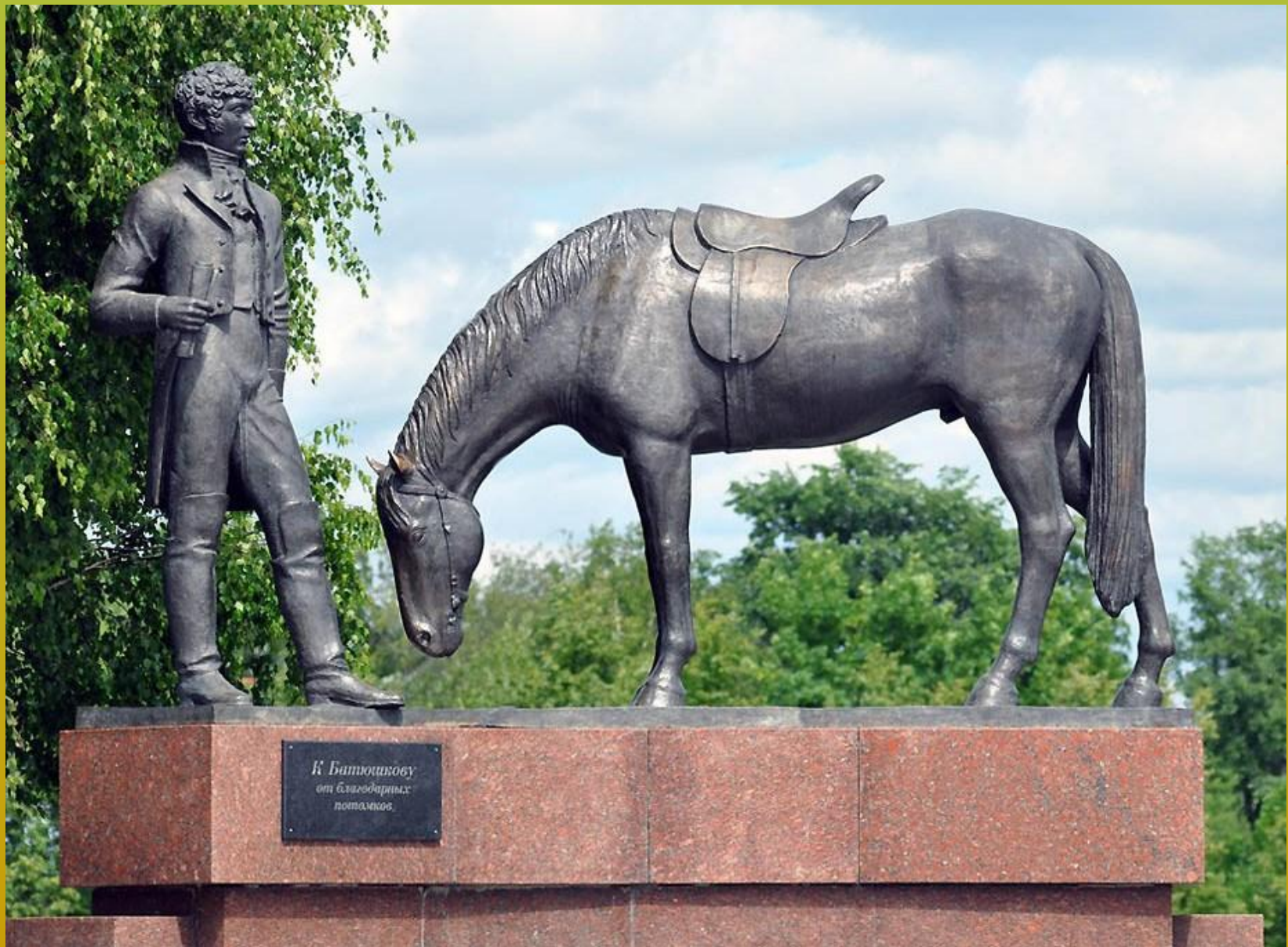
le monument de Konstantine Batiouchkov