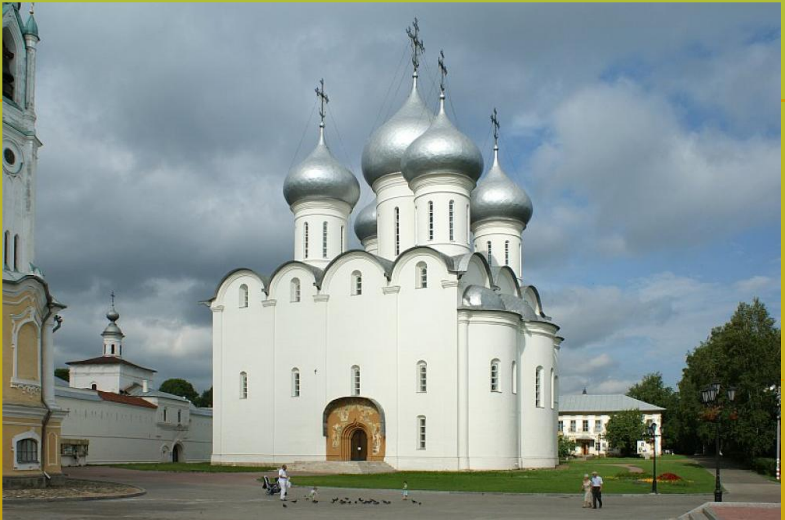
la cathédrale de Sainte Sophie