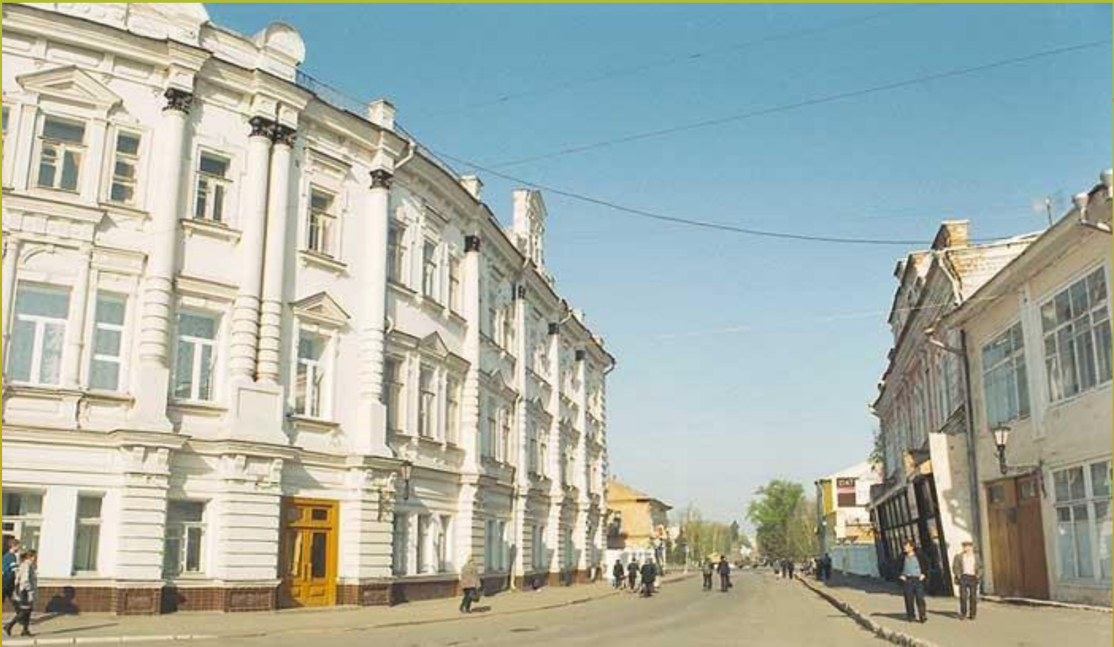
le Pont Kamenny