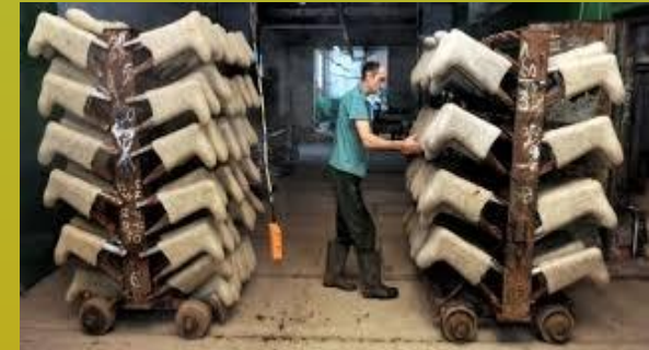
la production de bottes de feutre