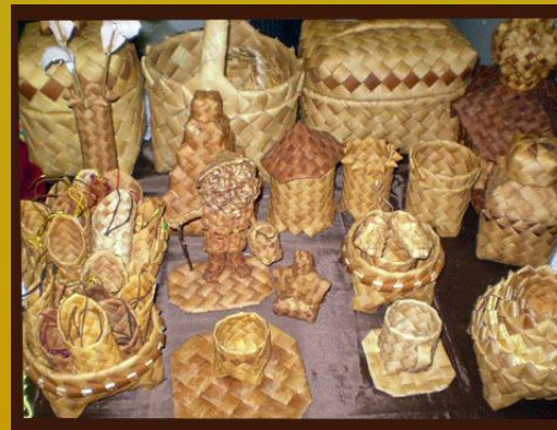
l'écorce de bouleau