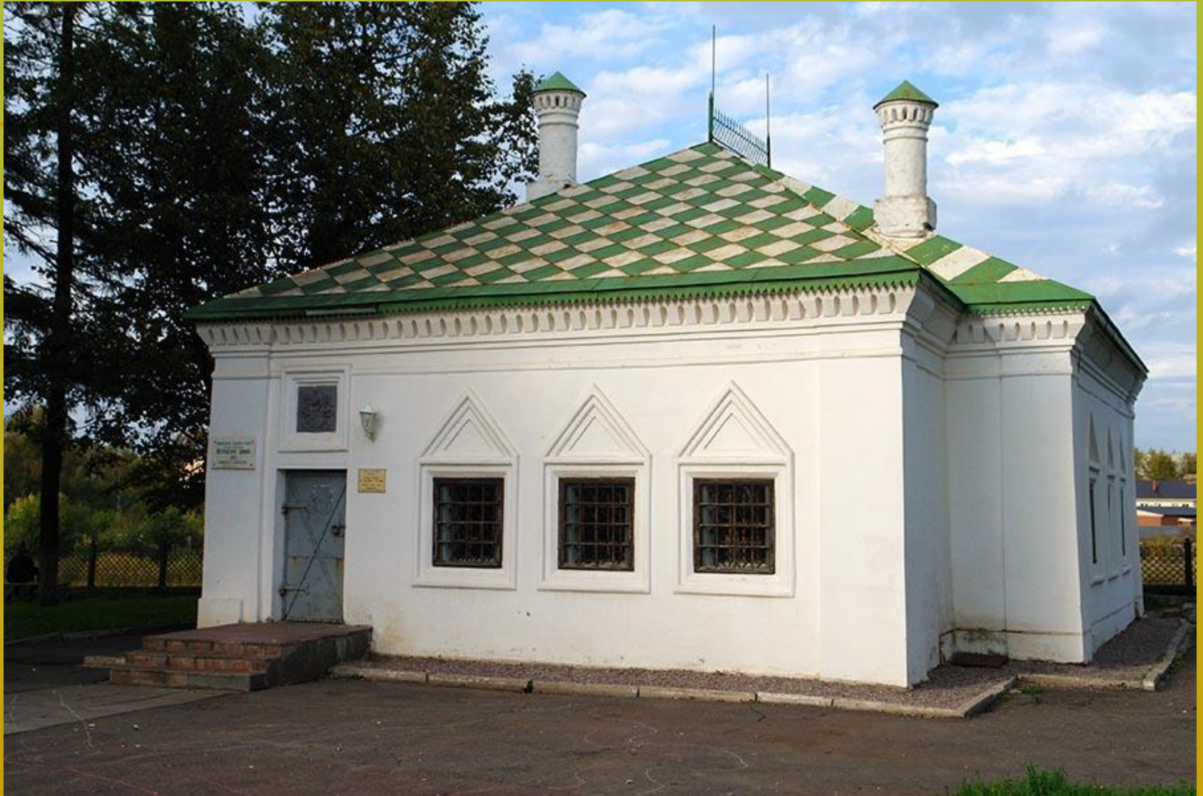
la Maisonette de Pierre le Grand