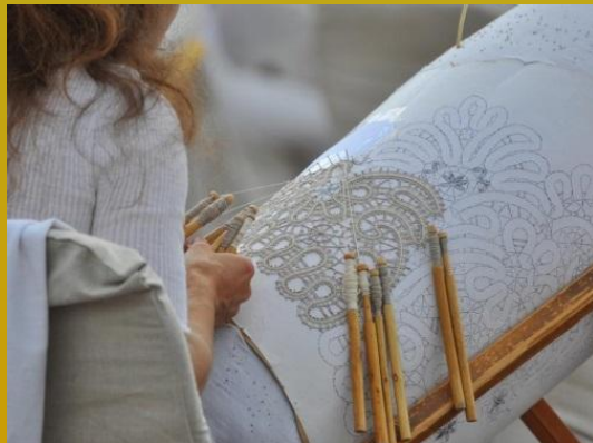
la dentelle aux fuseaux de Vologda