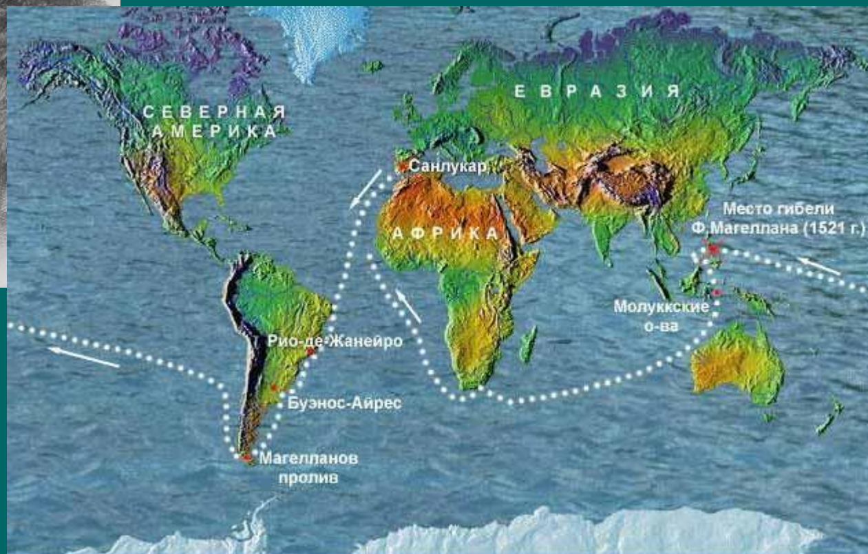
Первая кругосветная экспедиция Ф. Магеллана. 1519-1522 гг.