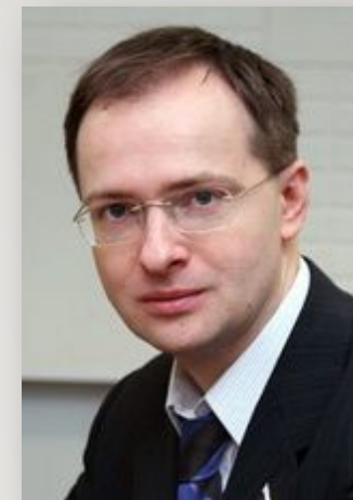
Мединский В.Р. Министр культуры