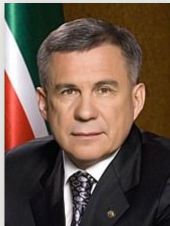
Минниханов Р.Н. Президент РТ