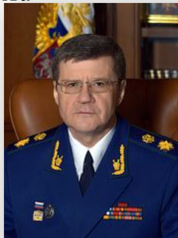
Чайка Ю.В. Генеральный Прокурор РФ