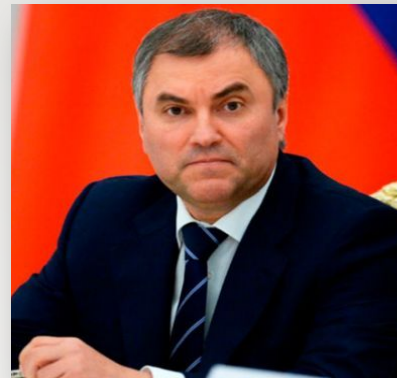
Володин В.В. Председатель Государственной Думы