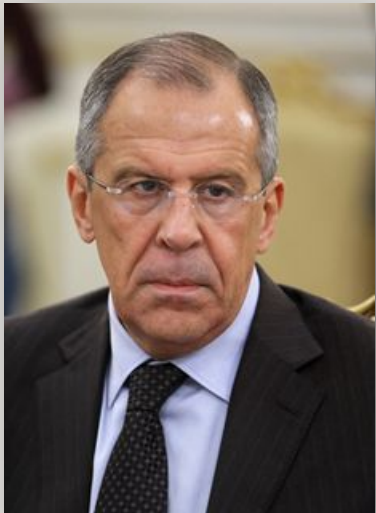
Лавров С.В. Министр иностраннх дел