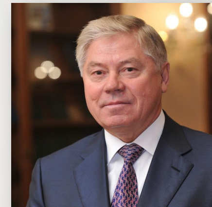
Лебедев В.М. Председатель Верховного суда РФ