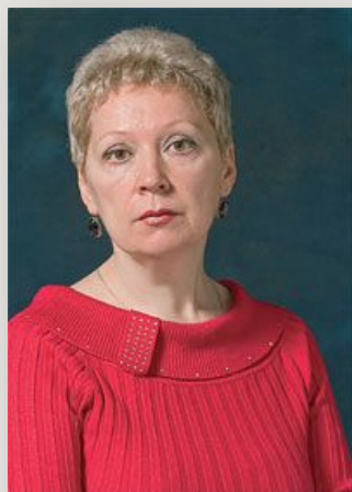
Васильева О.Ю. Министр образования