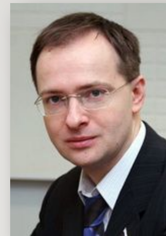
Мединский В.Р. Министр культуры