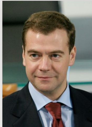
Медведев Д.С. Председатель Правительства