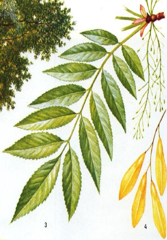
Ясень обыкновенный: 1 — общий вид; 2 — укороченный побег с пучками цветков (а — пестичный, б — обоеполый, в — тычиночный); 3 — часть побега с листом и мелкими плодиками; 4 — плоды.