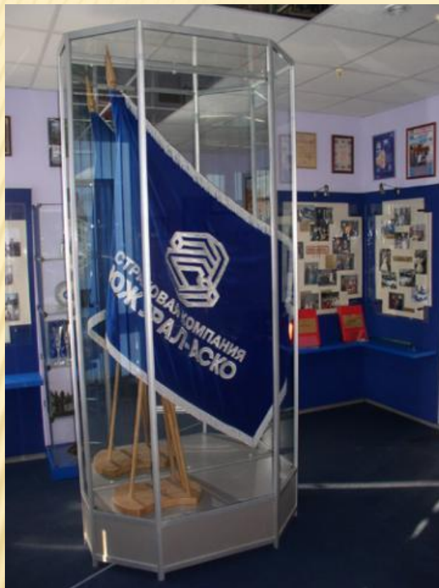
ФРАГМЕНТ ЭКСПОЗИЦИИ: ЗНАМЯ КОМПАНИИ