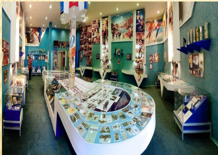
ОБЩИЙ ВИД ЭКСПОЗИЦИИ