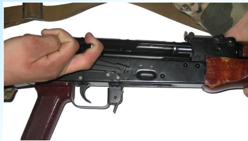
Отвести затворную раму назад и убедиться, что в патроннике нет патрона