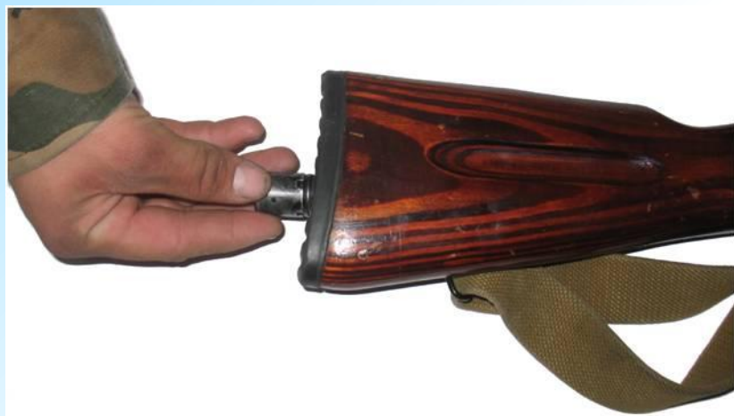
вынуть пенал с принадлежностями