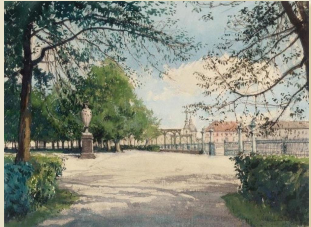
Александр Бенуа «Летний сад»