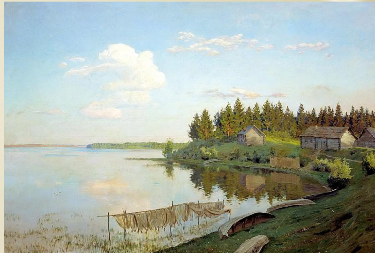
Левитан Исаак – На озере