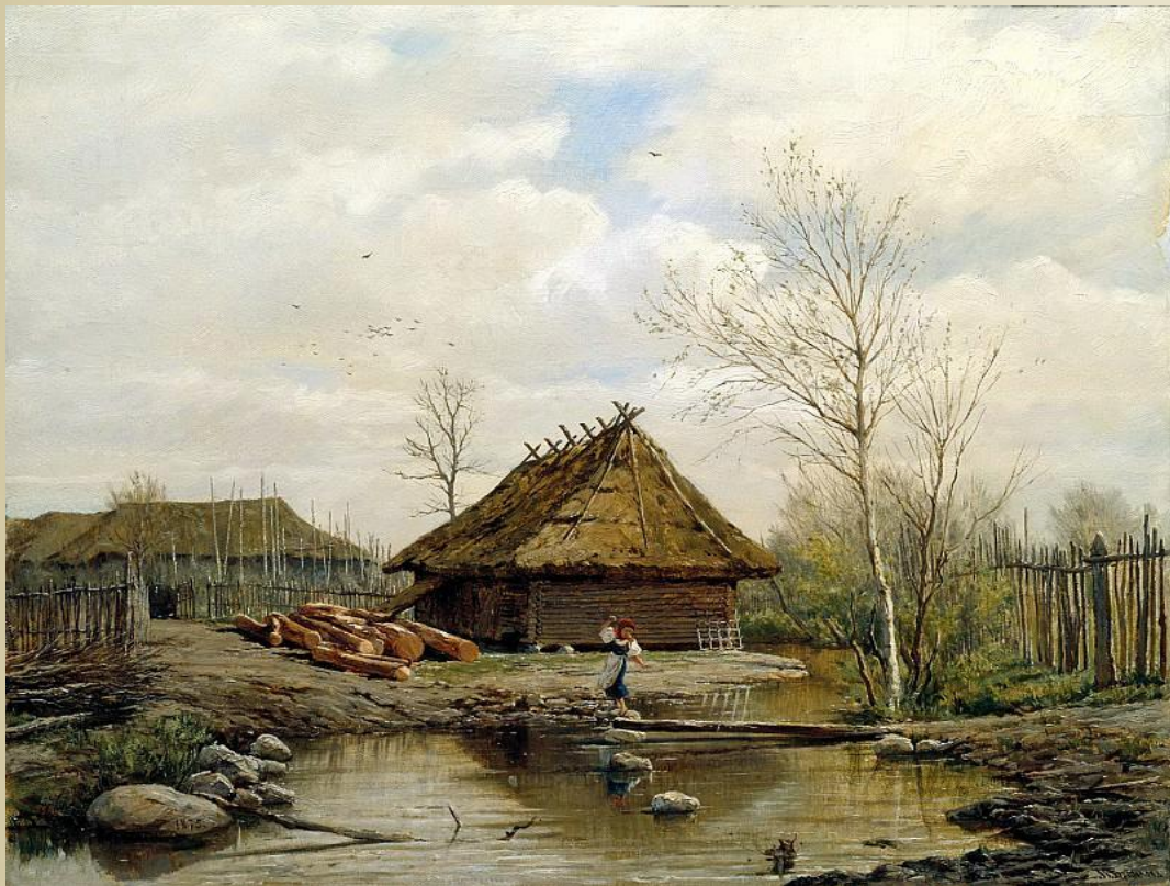
Брюллов Павел - Весна

отражает поэзию деревенского быта, его естественную связь с окружающей природой.