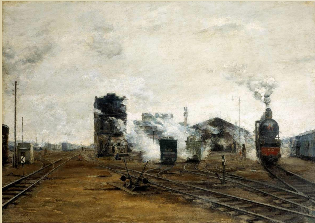
Транспорт налаживается. 1923. Художник Борис Яковлев

показывает роль и значение человека – создателя, строителя заводов, фабрик, электростанций, вокзалов и мостов.