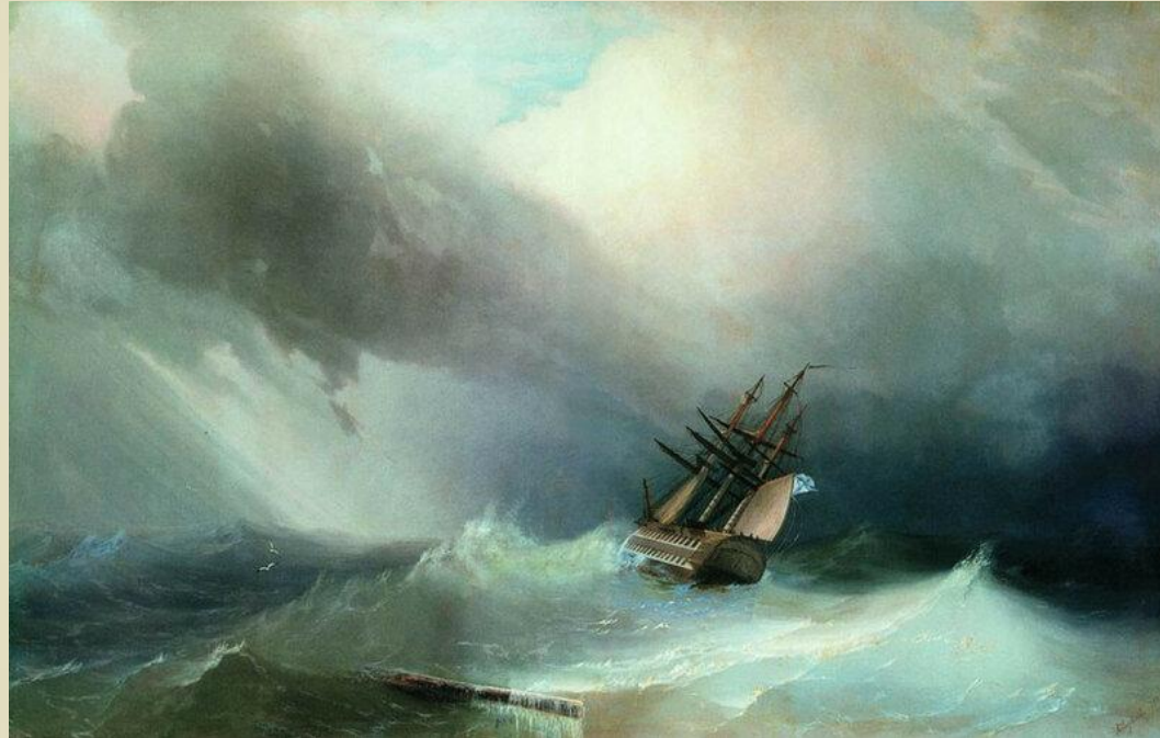
“Буря” Иван Айвазовский