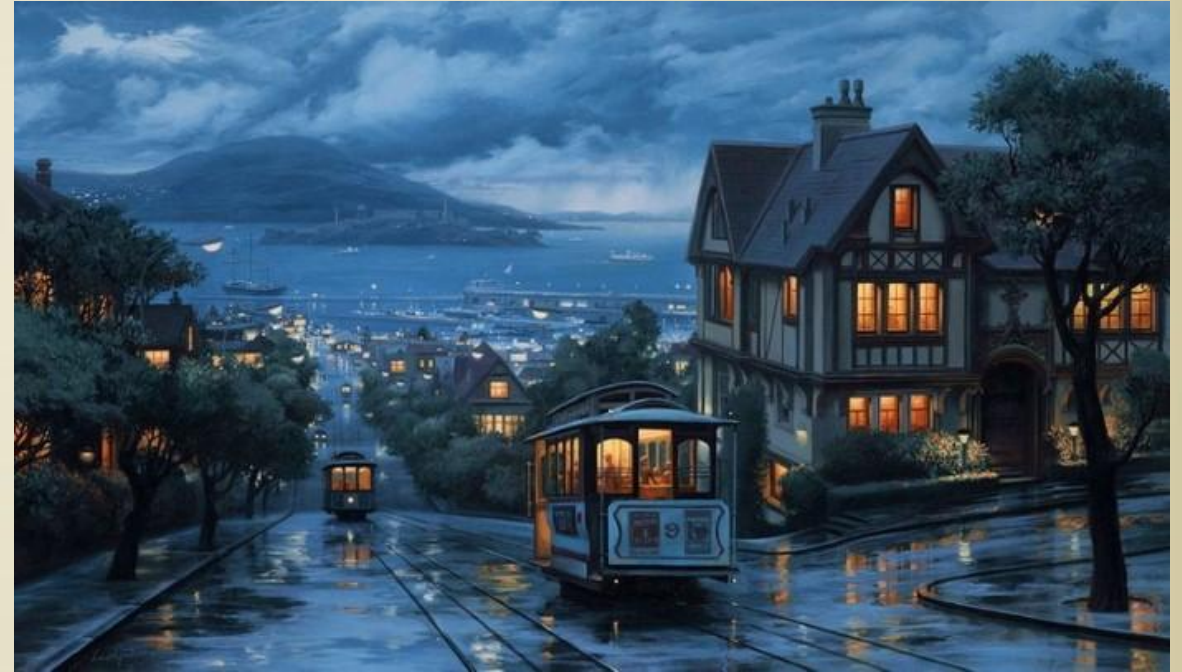
«Городской пейзаж» Евгений Лушпин.