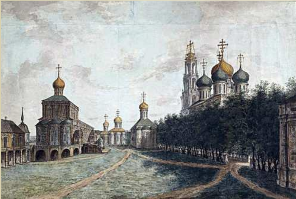
«Троице-Сергиева лавра» Алексеев Федор

изображает организованную человеком пространственную среду – здания, улицы, проспекты, площади, набережные, парки.