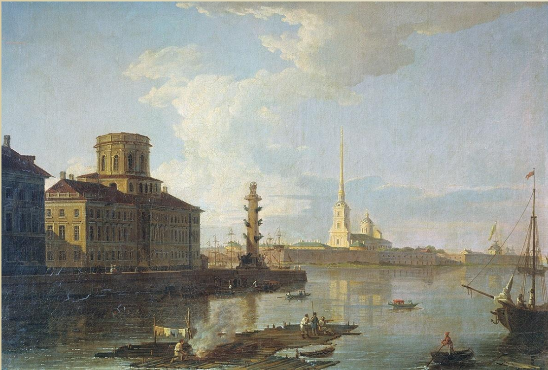
Максим Воробьев «Петропавловская крепость»

близок к городскому пейзажу, но здесь художник больше внимания обращает на изображение памятников архитектуры в синтезе с окружающей средой.