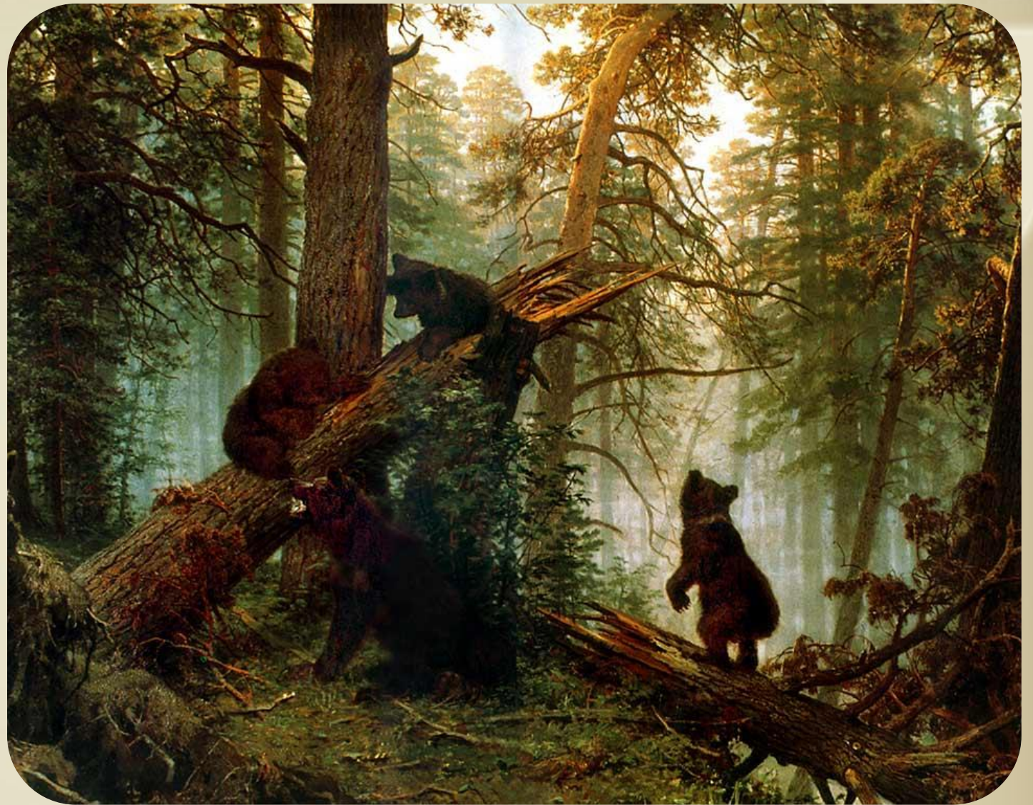
Иван Шишкин «Три медведя»