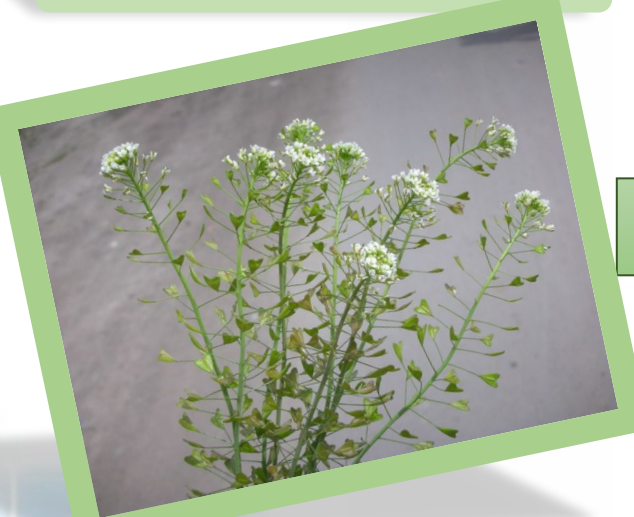
б) пастушья сумка