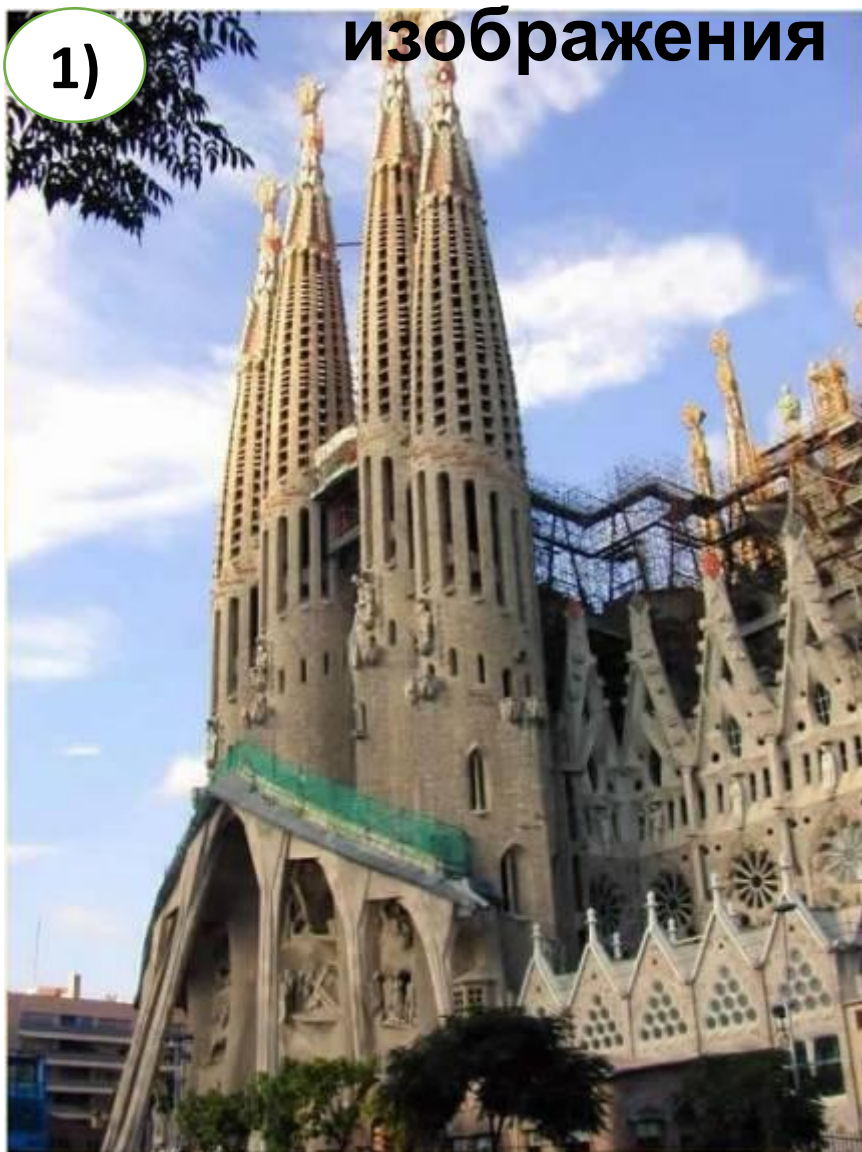
А. Кёльнский собор (средневековье)