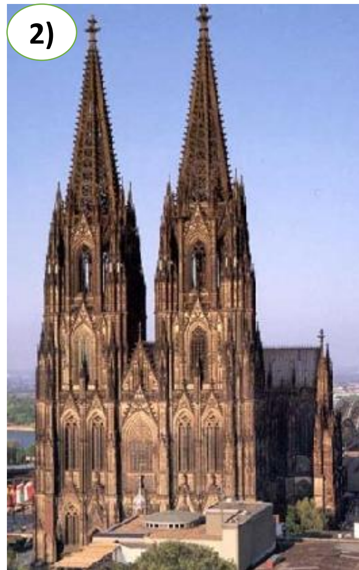
Б. «Собор святого семейства» Антонио Гауди (XX век)