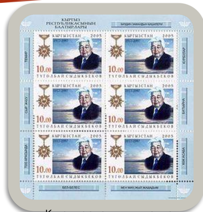
Кыргызстандын почта маркасы, 2005-жыл