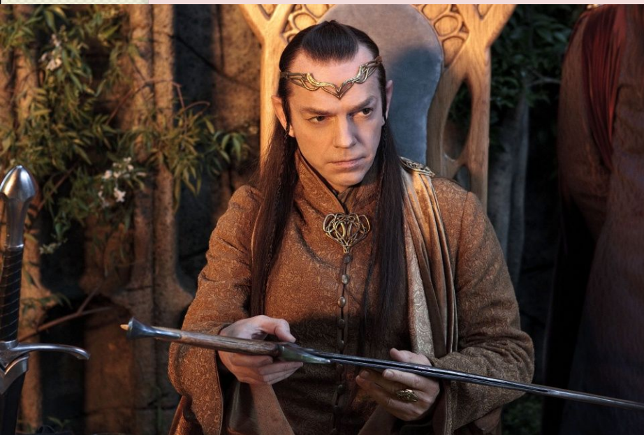
Лорд Елронд, напівельф