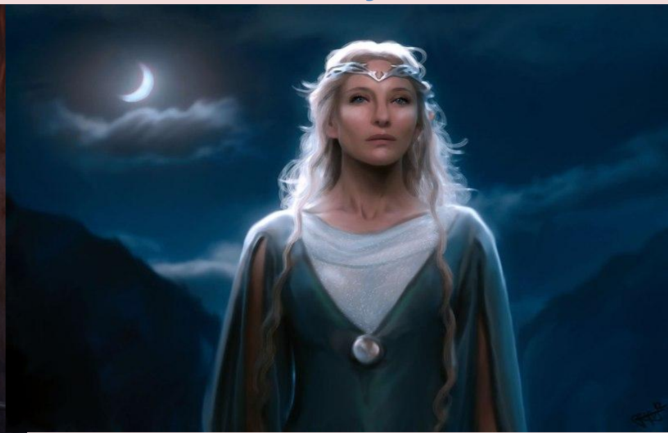
Ельфійська королева леді Галадріель