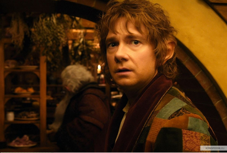
Гобітт, Більбо Бегінс