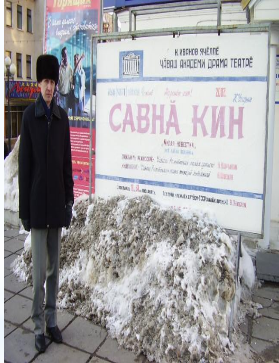
Комедия «Милая невестка» («Савнă кин») – 2007г., Чувашский академический драмтеатр., режиссёр Корчаков Н. В.