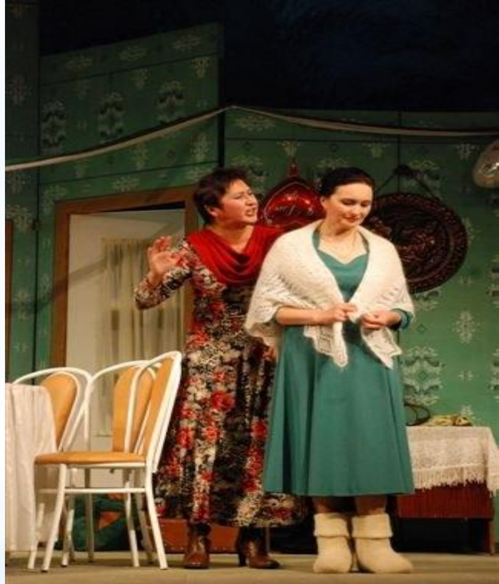
Мелодрама «Свадьба отменяется?» («Туй пулать –и, пулмасть –и?») – 2008 г., Чувашский академический драмтеатр, режиссёр А. Павлов