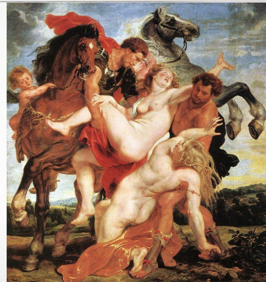
«Похищение Дочерей Левкиппа», 1618

В октябре 1609 года Рубенс сочетался браком с Изабеллой Брант, дочерью известного гуманиста Яна Бранта. В последующее десятилетие Рубенс достиг в Европе славы, с которой из художников предыдущих эпох мог сравниться только Тициан.