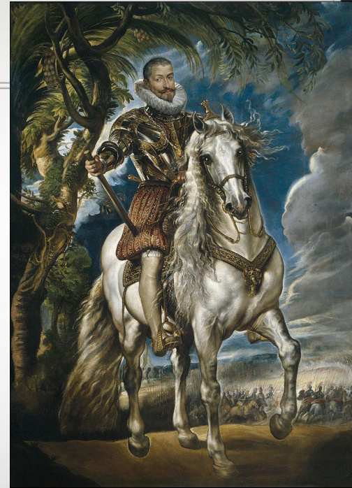
Герцог Лерма. Портрет работы Рубенса.

В 1605 году брат Рубенса, будучи учеником гуманиста Липсия, занял место библиотекаря при ватиканском кардинале Асканио Колонна и пригласил молодого художника в Рим. После двух лет изучения классических древностей в компании брата Рубенс (летом 1607 года) был вызван для исполнения портретов генуэзской аристократии на Ривьеру.