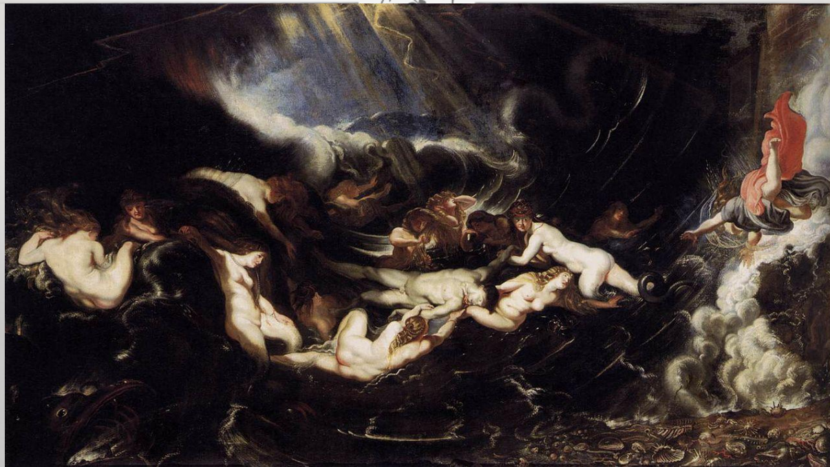
«Геро и Леандр» из собрания Рембрандта