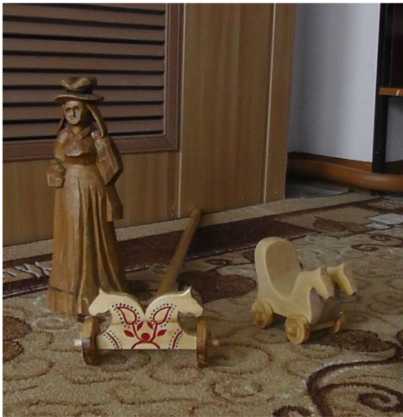
Копии деревянных игрушек