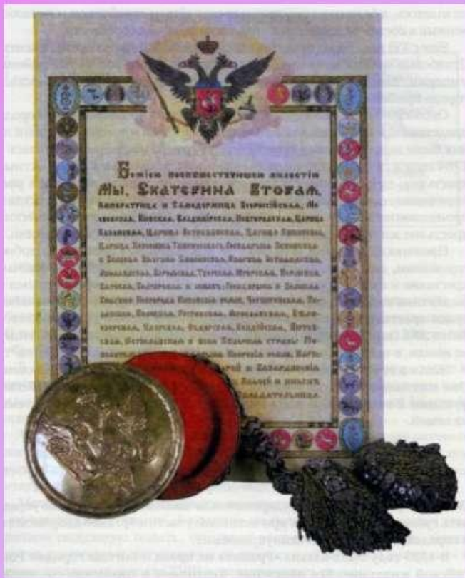
"Жалованная грамота дворянству", подписанная Екатериной II в 1785 году.