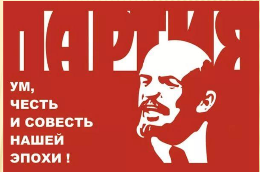
Плакат эпохи Брежнева