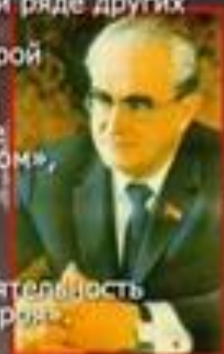
Юрий Андропов Председатель КГБ СССР (1967 - 1982г.г.)

Совершенно секретно, 28 марта 1981 г. «...В последнее время в Москве и ряде других городов страны появилась новая тенденция в настроениях некоторой части научной и творческой интеллигенции, именующей себя «русистами» ...Опасность прежде всего состоит в том, что «русизмом», т.е. демагогией о необходимости борьбы за сохранение русской культуры, памятников старины, за «спасение русской нации», прикрывают свою подрывную деятельность откровенные враги советского строя»