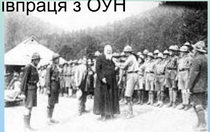
Андрей Шептицький на Соколі