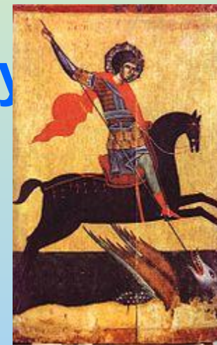
Святий Юрій — Патрон Пласту