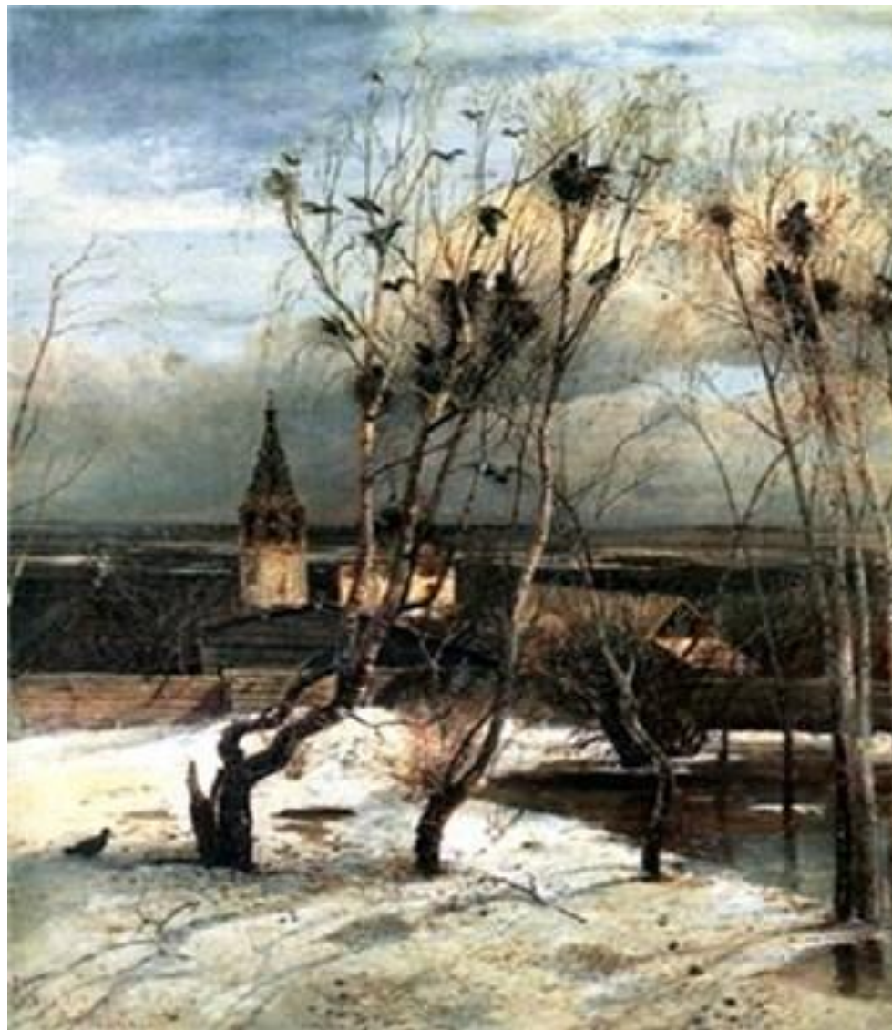
А.К.Саврасов «Грачи прилетели» (1871)