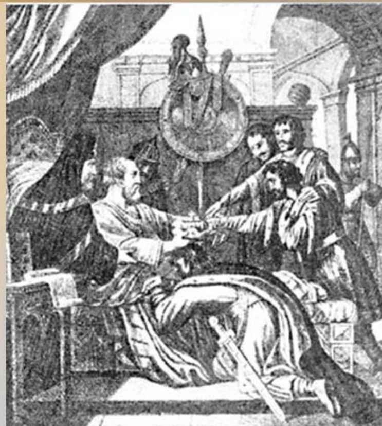
Завещание Ярослава Мудрого