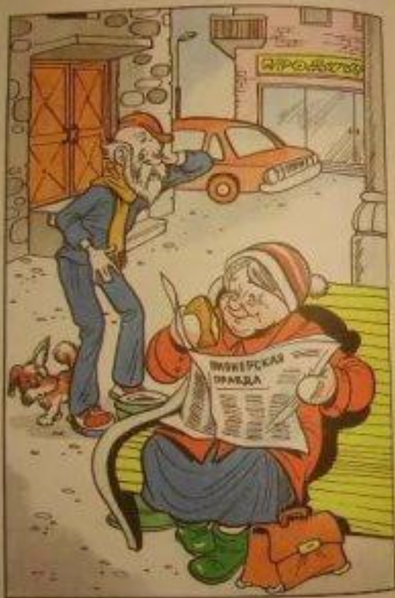
К «Сказке о лотерейном драмате»