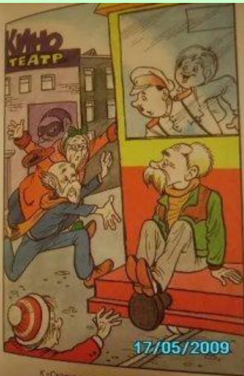
К «Сказке о лотерейном драмате»