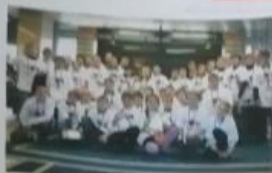
Поздравляем всех участников IV Международных интеллектуальных игр в Москве!