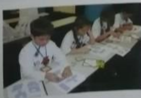
Всё же победит наш гололовок?