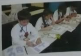
Или вы победит эти головоломки?