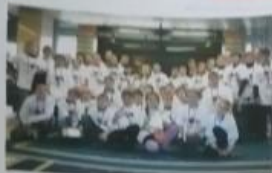
Поздравляем всех участников IV Международных интеллектуальных игр в Москве!