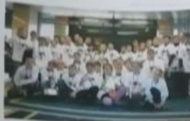
Поздравляем всех участников IV Международных интеллектуальных игр в Москве!