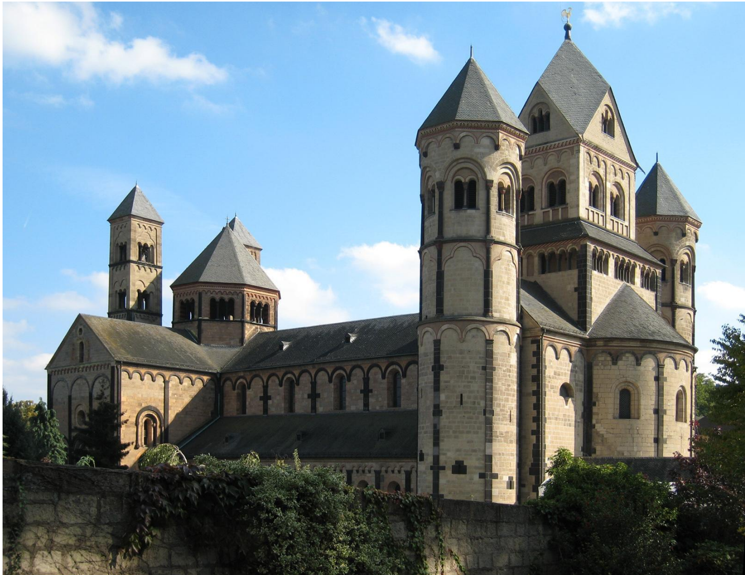
Аббатство Мария Лаах, Германия