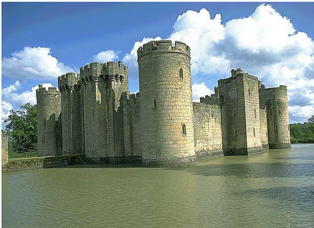
Норманнская крепость, Франция