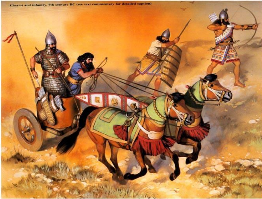
9th century BC (see text commentary for detailed caption)