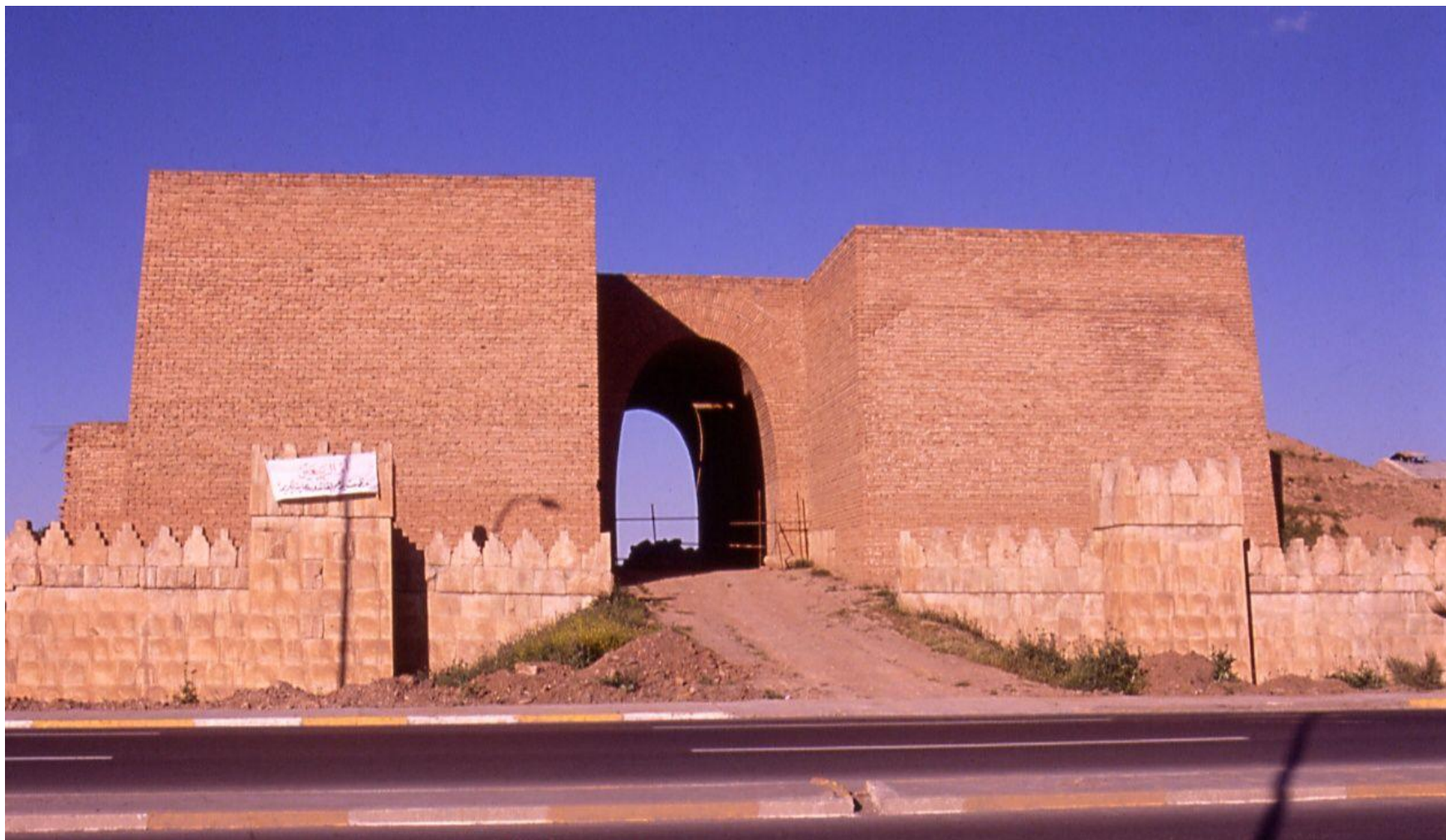
Недавно воссозданные ворота Ниневии