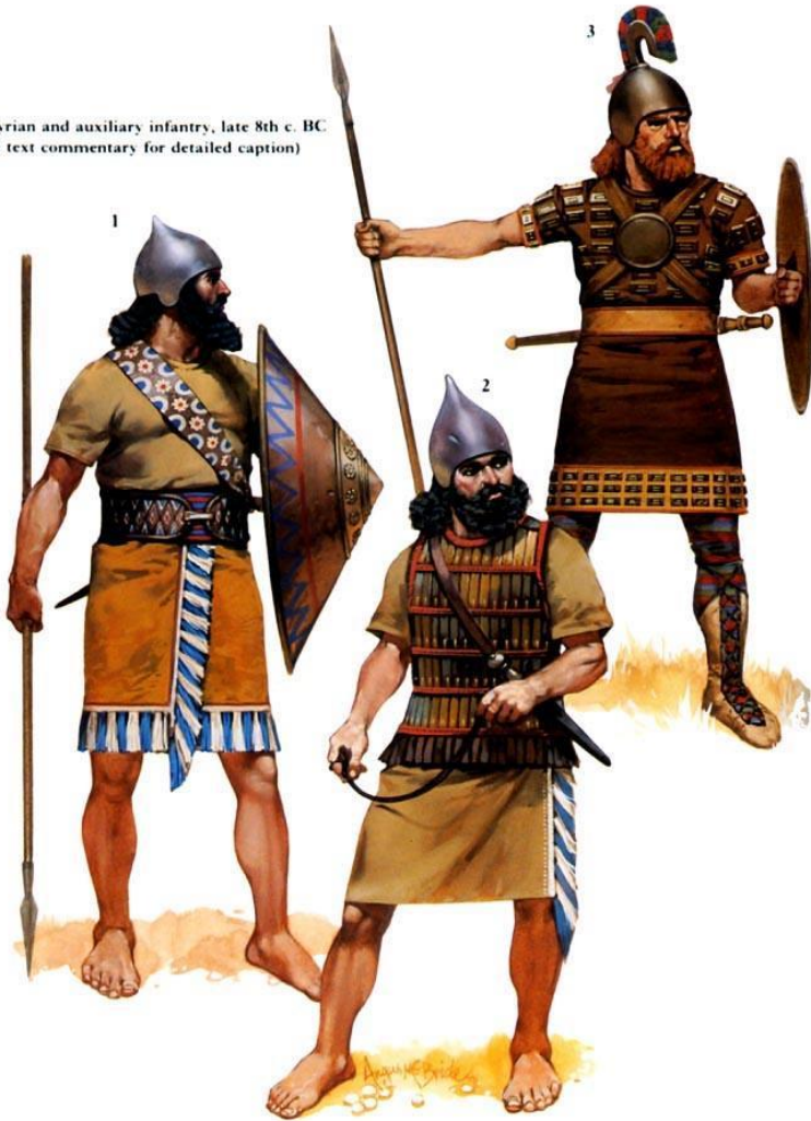
Assyrian and auxiliary infantry, late 8th c. BC (see text commentary for detailed caption)