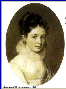
Екатерина Е. П. Автопортрет. 1816.