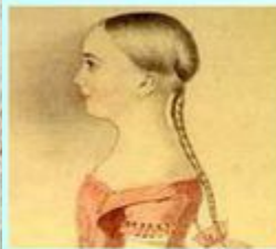
Старшая дочь, Мария Александровна Пушкина (1832-1919г.)