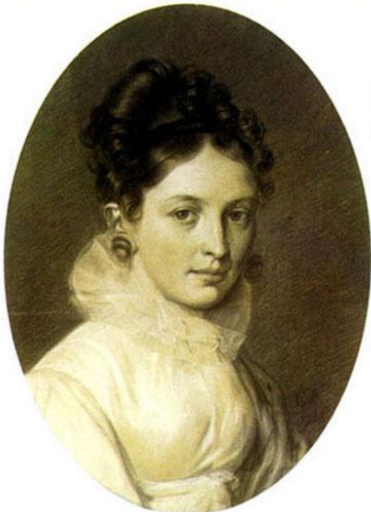
Бакунина Е.П. Автопортрет. 1816.