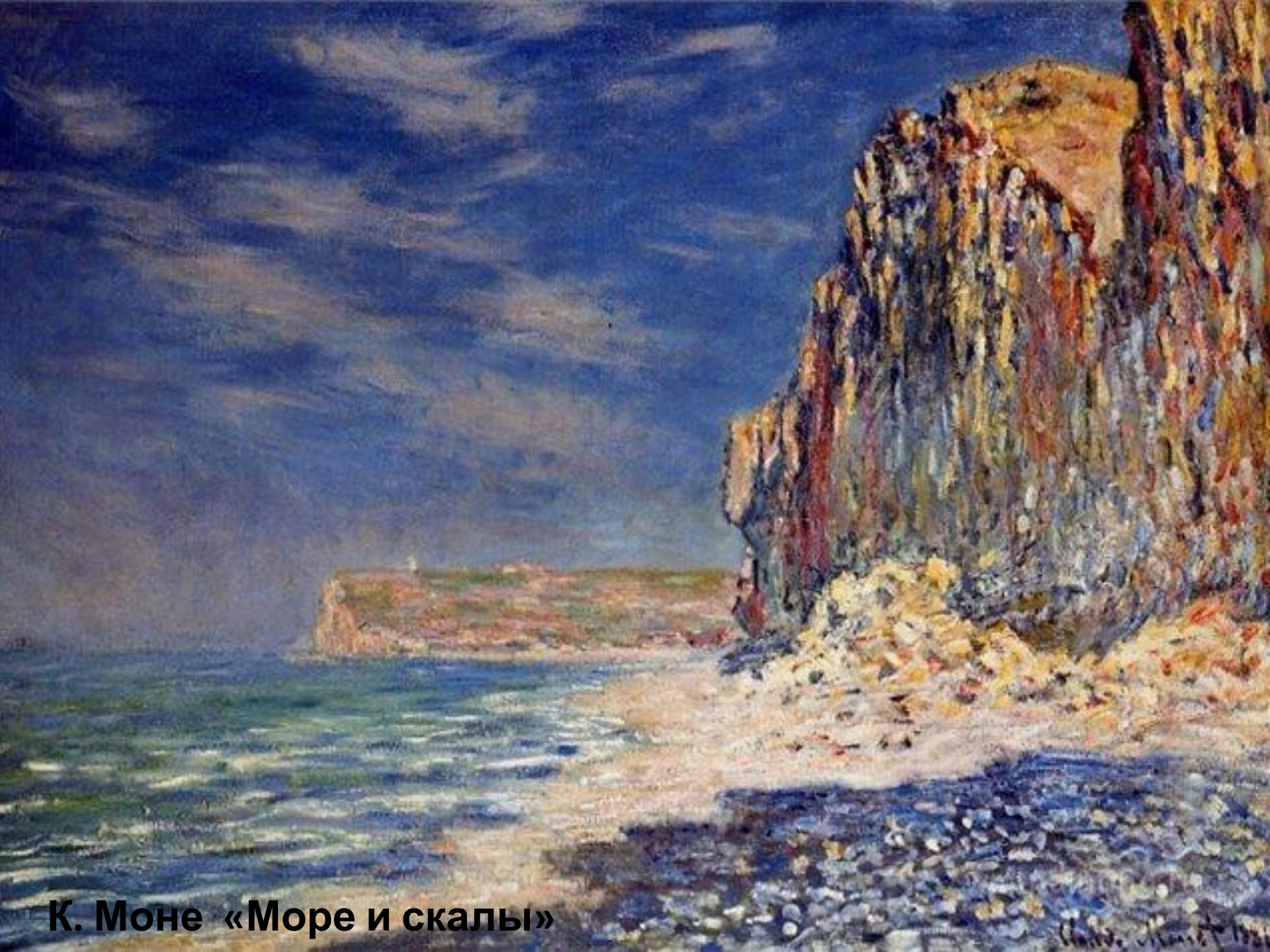
К. Моне «Море и скалы»