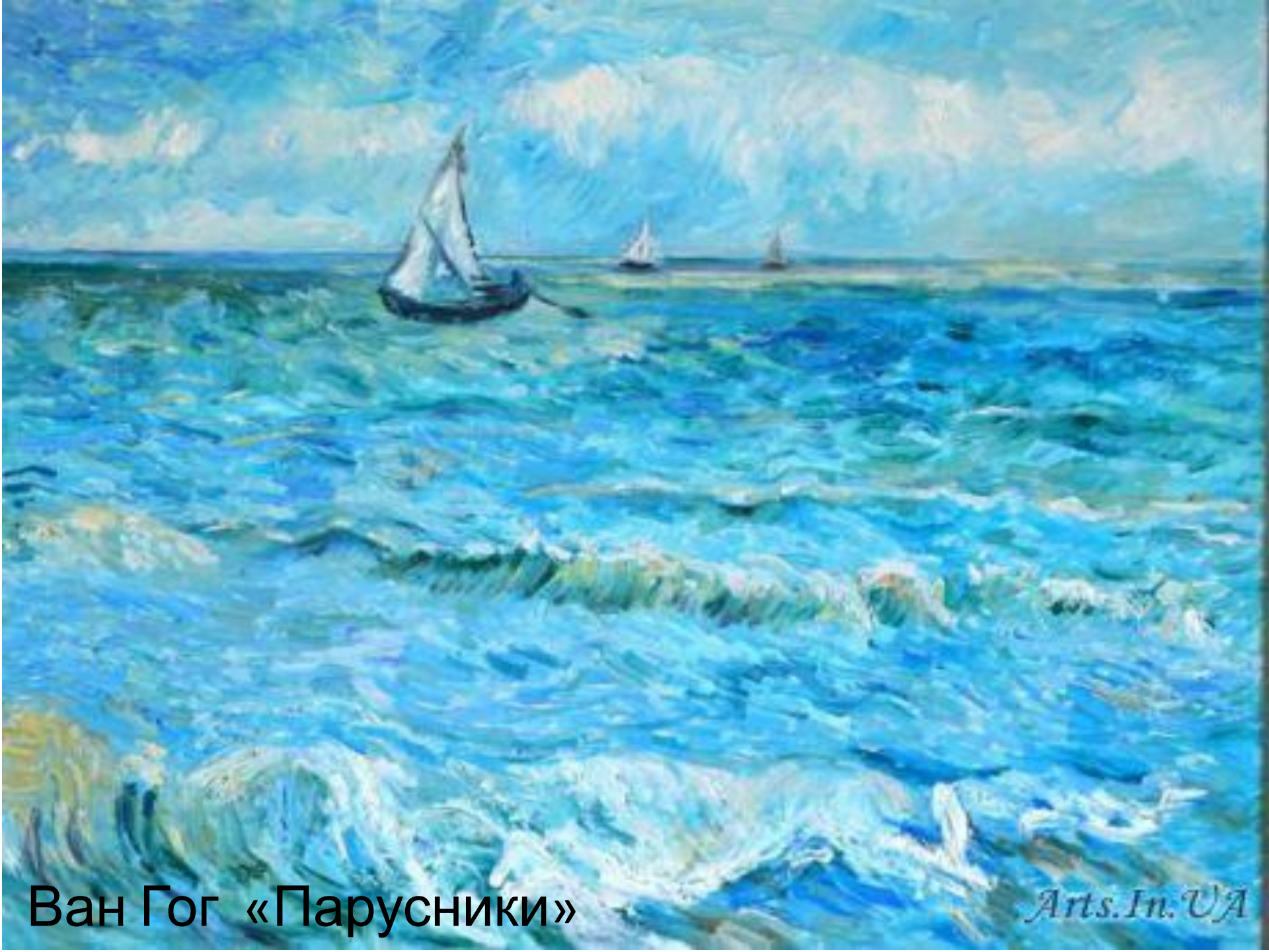
Ван Гог «Парусники»