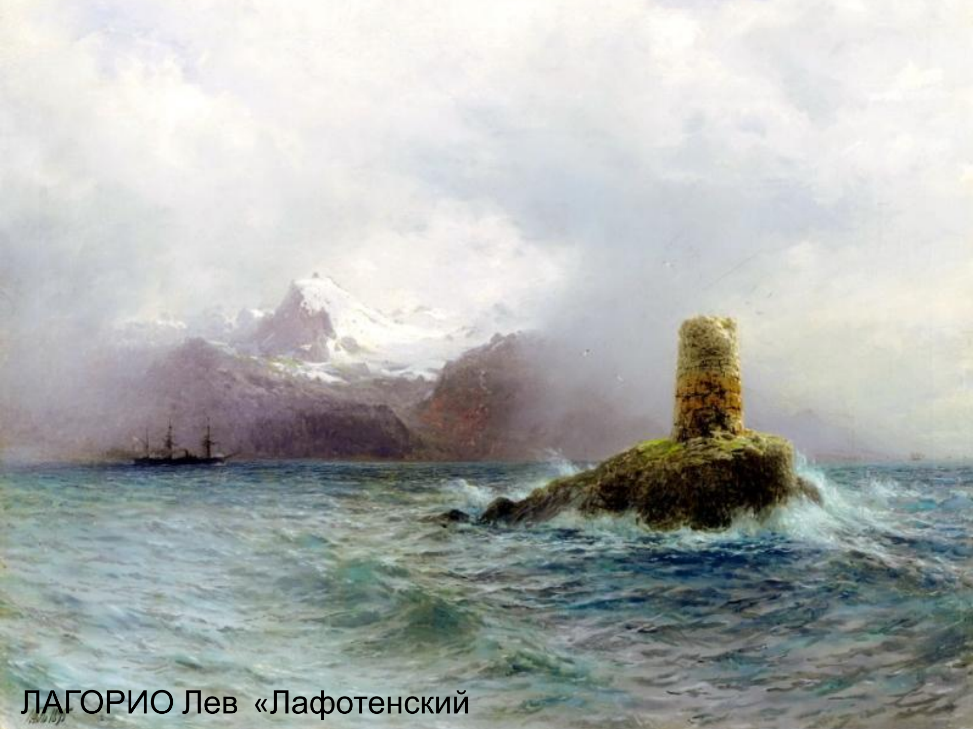
ЛАГОРИО Лев «Лафотенский»