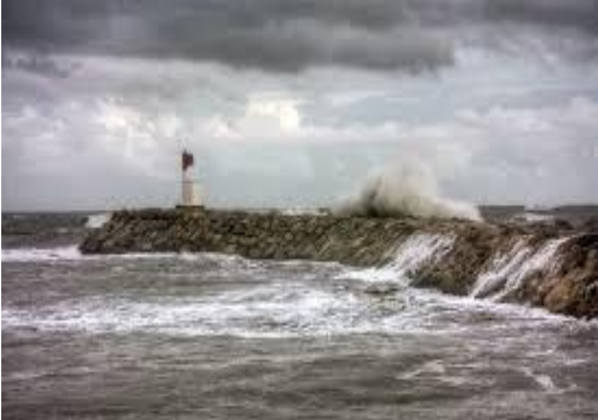
Ван Гог «Чувство моря»