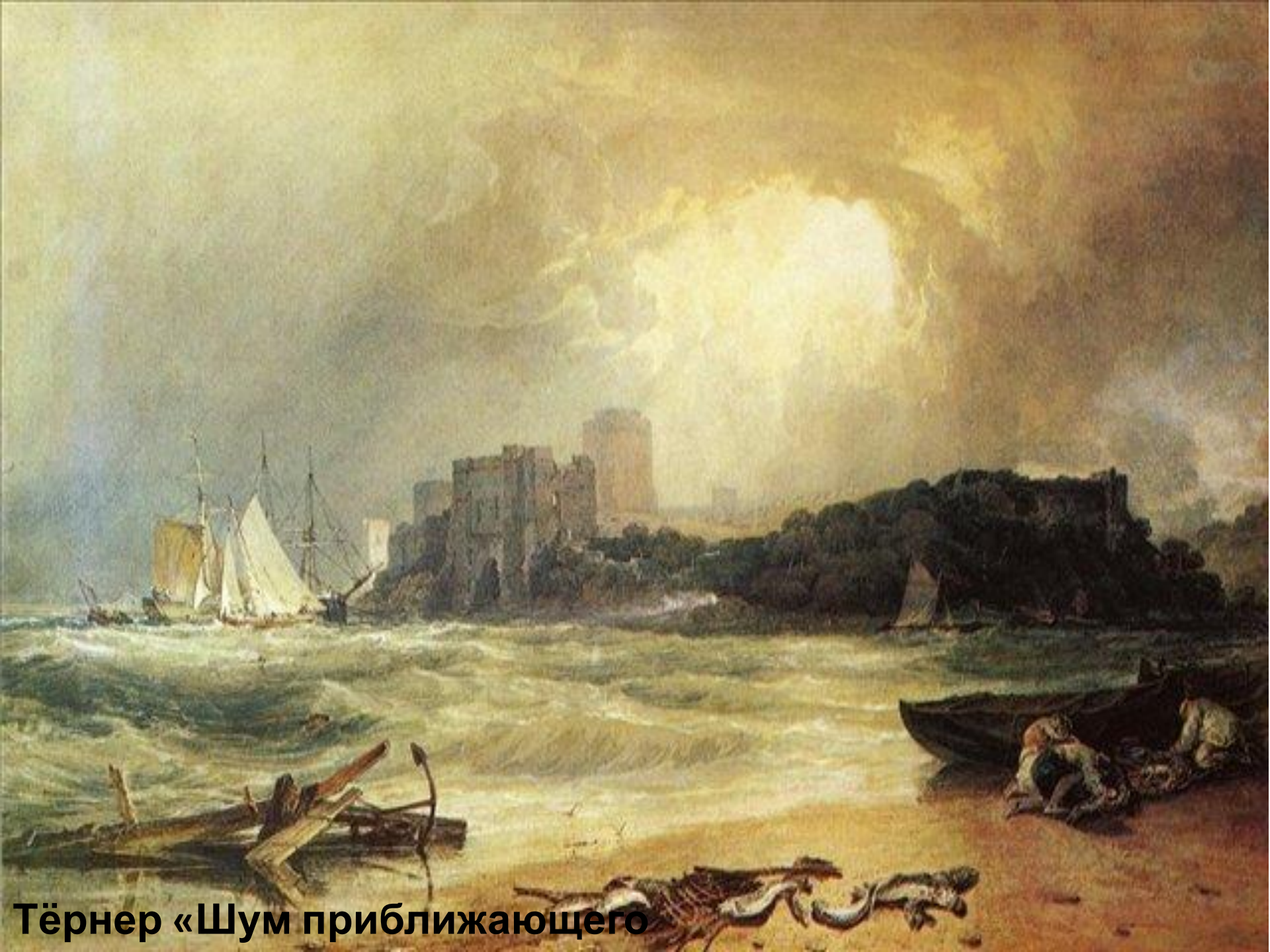
Тёрнер «Шум приближающего»