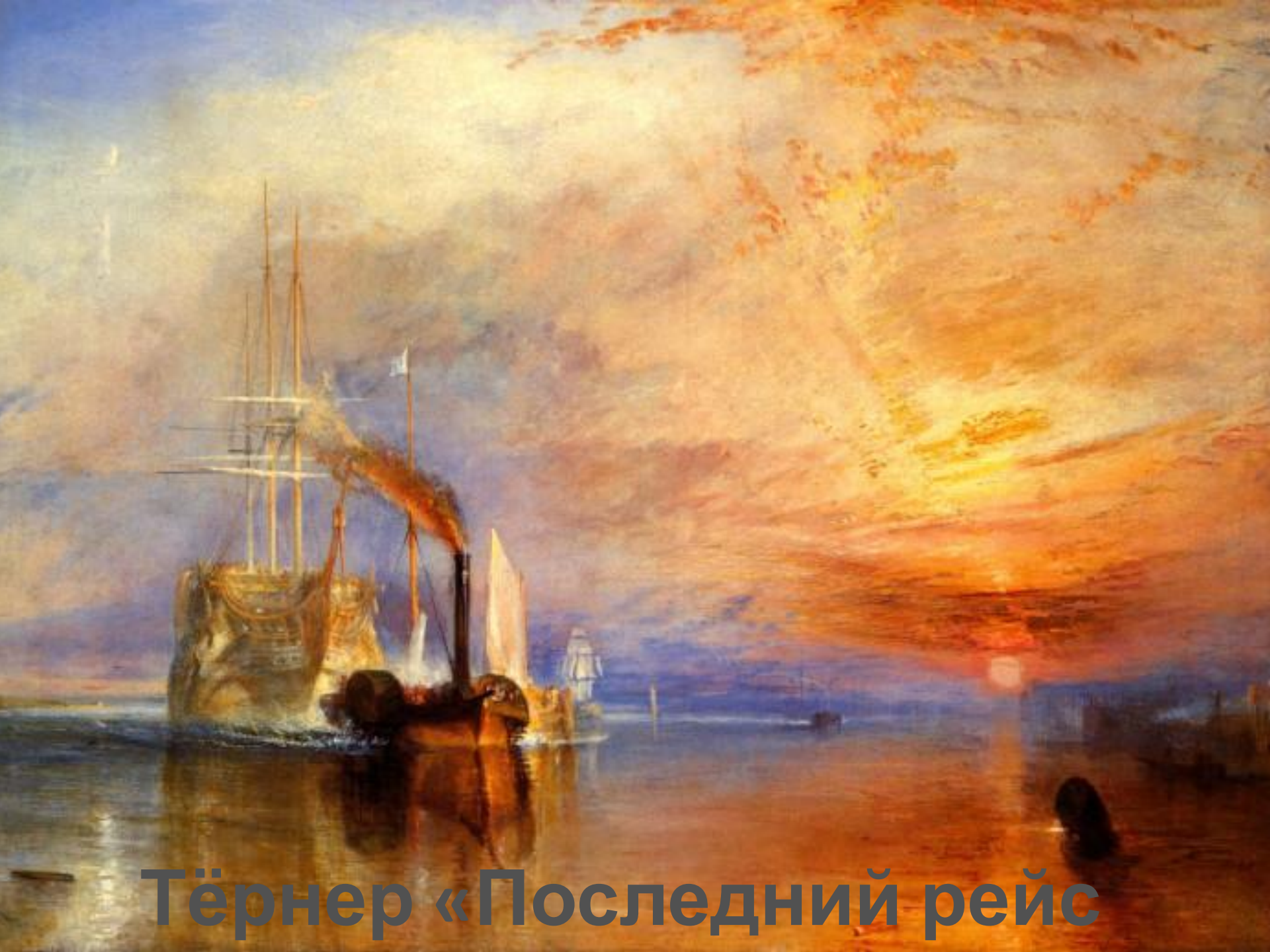
Тёрнер «Последний рейс»