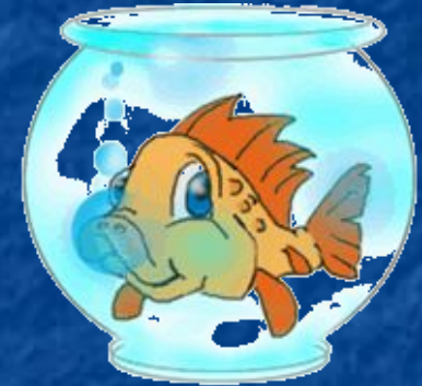
The fish/ swim