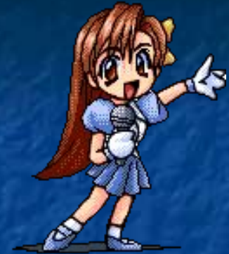
The girl/ sing