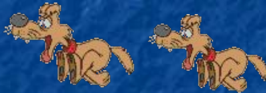
The dogs/ run