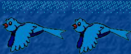
The birds/ fly