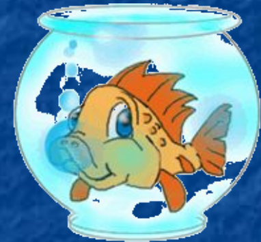
The fish/ swim