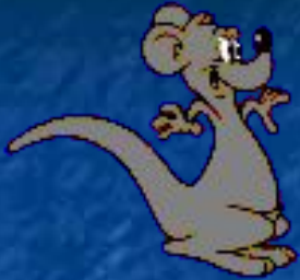
The kangaroo/ jump