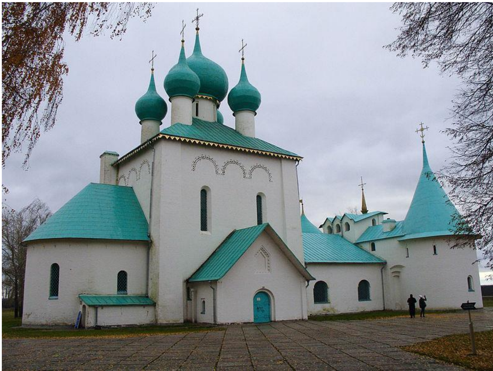
Храм Сергия Радонежского на Куликовом поле