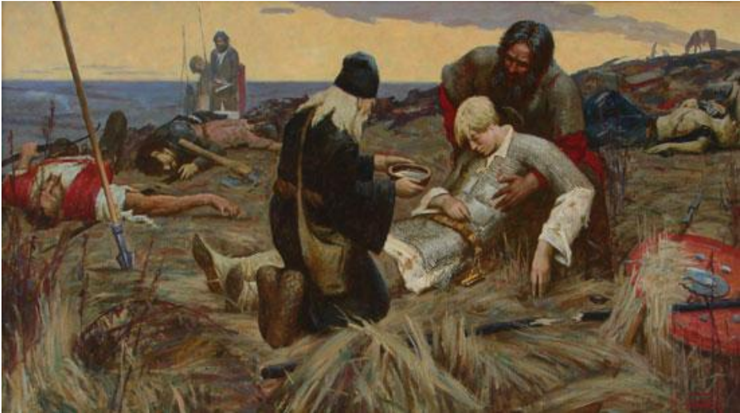
Художник И.Панов «Куликово поле»

Решающая победа русских (хан Мамай утратил политическое влияние в Орде, к выгоде Тохтамыш)