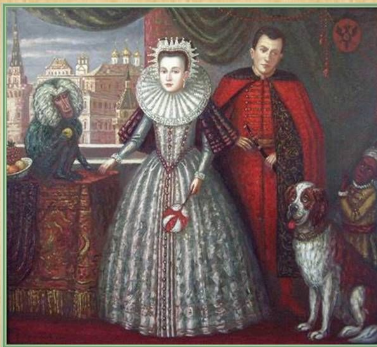
Лжедмитрий I и Мария Мнишек

Самозванец - человек, выдающий себя за лицо, которым он не является, обычно в корыстных (мошенничество) или политических целях.