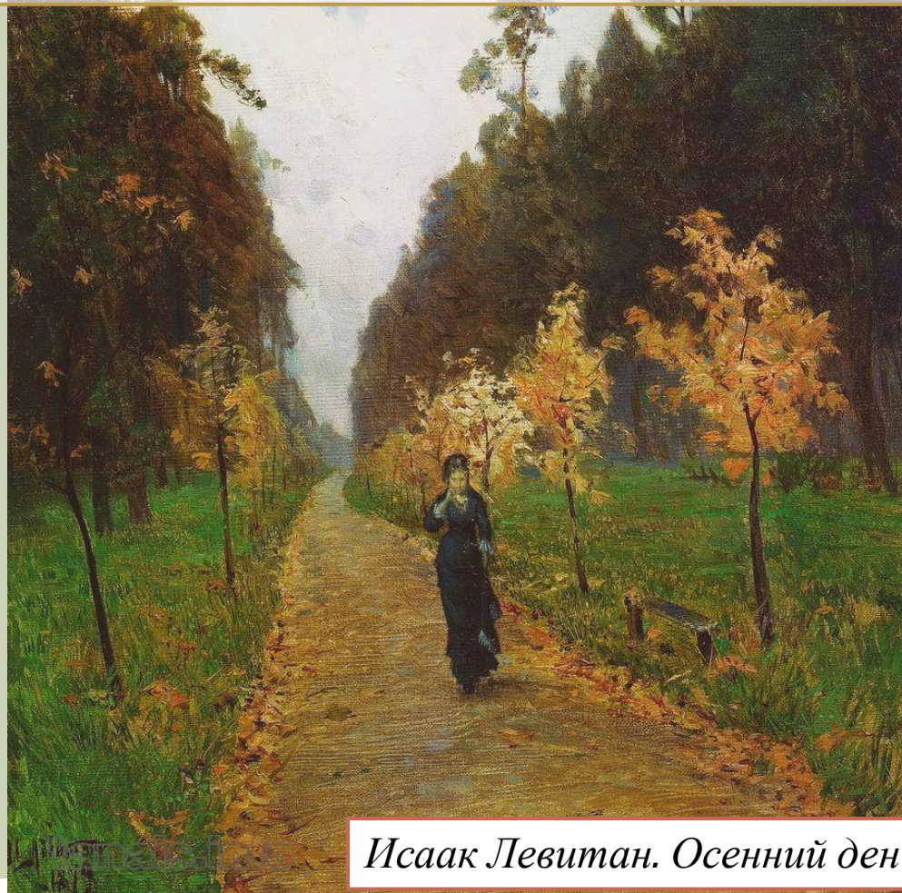
Исаак Левитан. Осенний день. Сокольники (1879 г.)