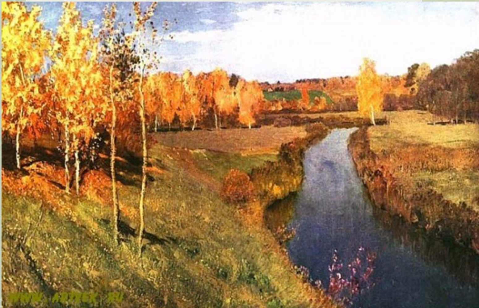
Золотая осень, Исаак Ильич Левитан, 1895