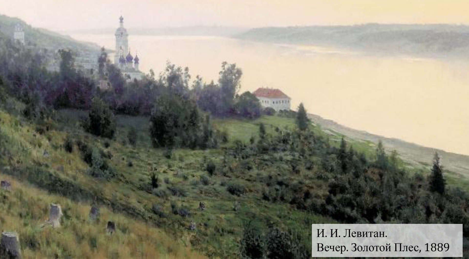
И. И. Левитан. Вечер. Золотой Плес, 1889

Природа. Её рисуют художники, о ней пишут стихи поэты. У художников - краски, у поэтов - слова. У композитора - только звуки.