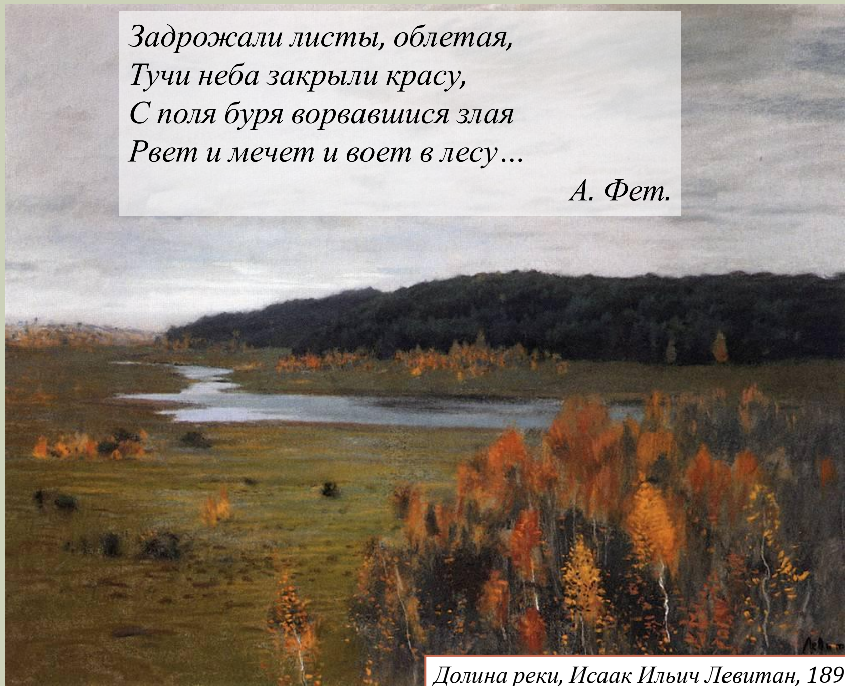
Долина реки, Исаак Ильич Левитан, 1895