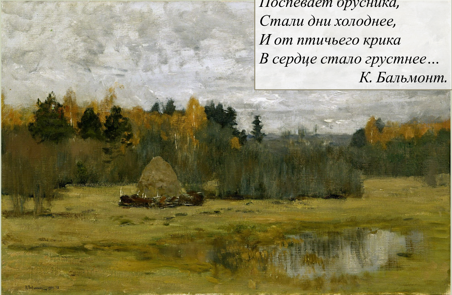
Исаак Левитан. Поздняя осень. 1894-1898

Поспевает брусника, Стали дни холоднее, И от птичьего крика В сердце стало грустнее... К. Бальмонт.