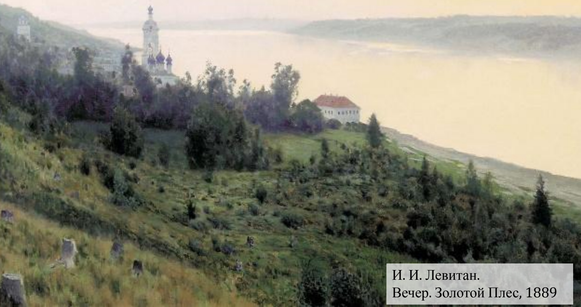
И. И. Левитан. Вечер. Золотой Плес, 1889

Природа. Её рисуют художники, о ней пишут стихи поэты. У художников - краски, у поэтов - слова. У композитора - только звуки.