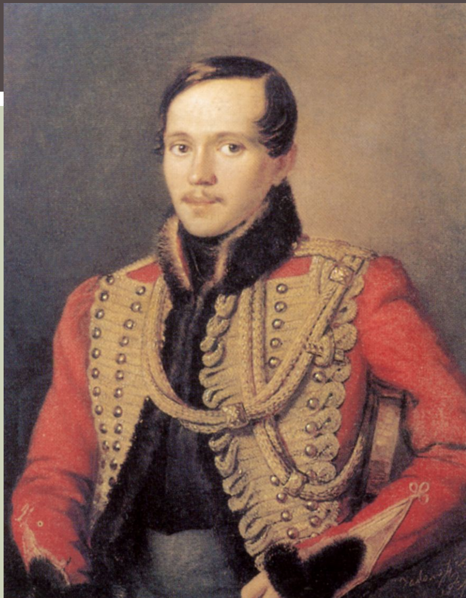
Лермонтов М. Ю.